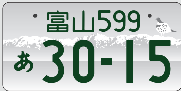
登録車(自家用) 寄付金なし