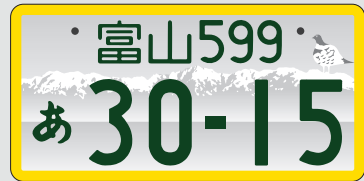
軽自動車(自家用) 寄付金なし

登録車：普通自動車、トラック、バス等(二輪車や、事業用の軽自動車は、図柄入りナンバーを取付ける事はできません。)