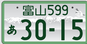
登録車(事業用) 寄付金なし