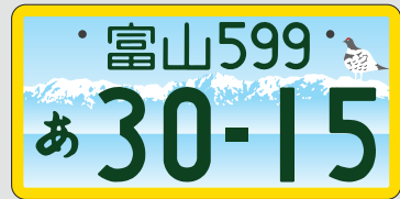
軽自動車(自家用) 寄付金あり