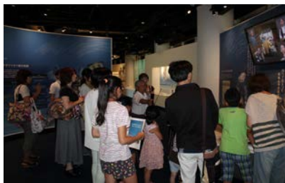
昨年度の自由研究講座の様子

いずれの企画も申し込みの締切日が、7月29日（水）となっています。詳しくは、資料館ホームページや募集チラシをご覧ください。