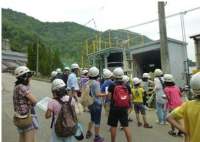
昨年度の日帰りバスツアーの様子