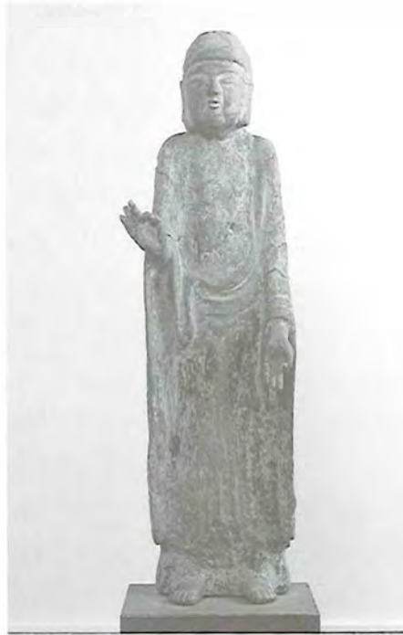
写真③：矢疵阿弥陀如来立像（木造）