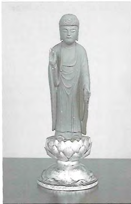
写真①：立山権現本地仏（木造）