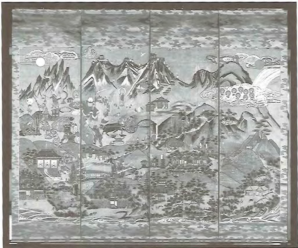
写真④：立山曼荼羅『来迎寺本』