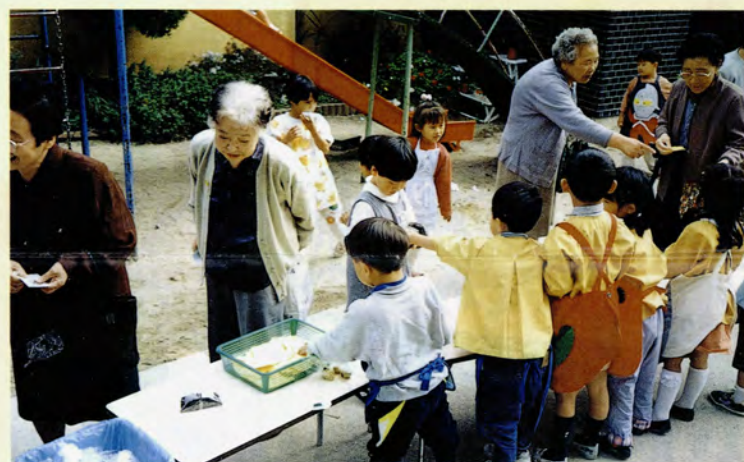
▲保育所内シルバー談話室での園児たちとのふれあい

最近では、ボランティアに携わる若者も増えています。このような福祉に関心を持つ人々が福祉を支える力になっていくことができるように、今後は福祉職場の説明会や福祉事業への就労斡旋などの充実に一層努めていきたいですね。 ●福祉の充実には人材の養成から 福祉の充実には、人材の養成・確保が最も重要です。富山県民福祉条例は、人材養成などのソフト面と施設整備などのハード面を絡めている点が、非常に心強く感じます。 ひと口に福祉従事者といっても、施設の専門職員から民生委員まで様々です。これらの人々の力を活かすためにも、条例の趣旨を踏まえた福祉行政を期待します。