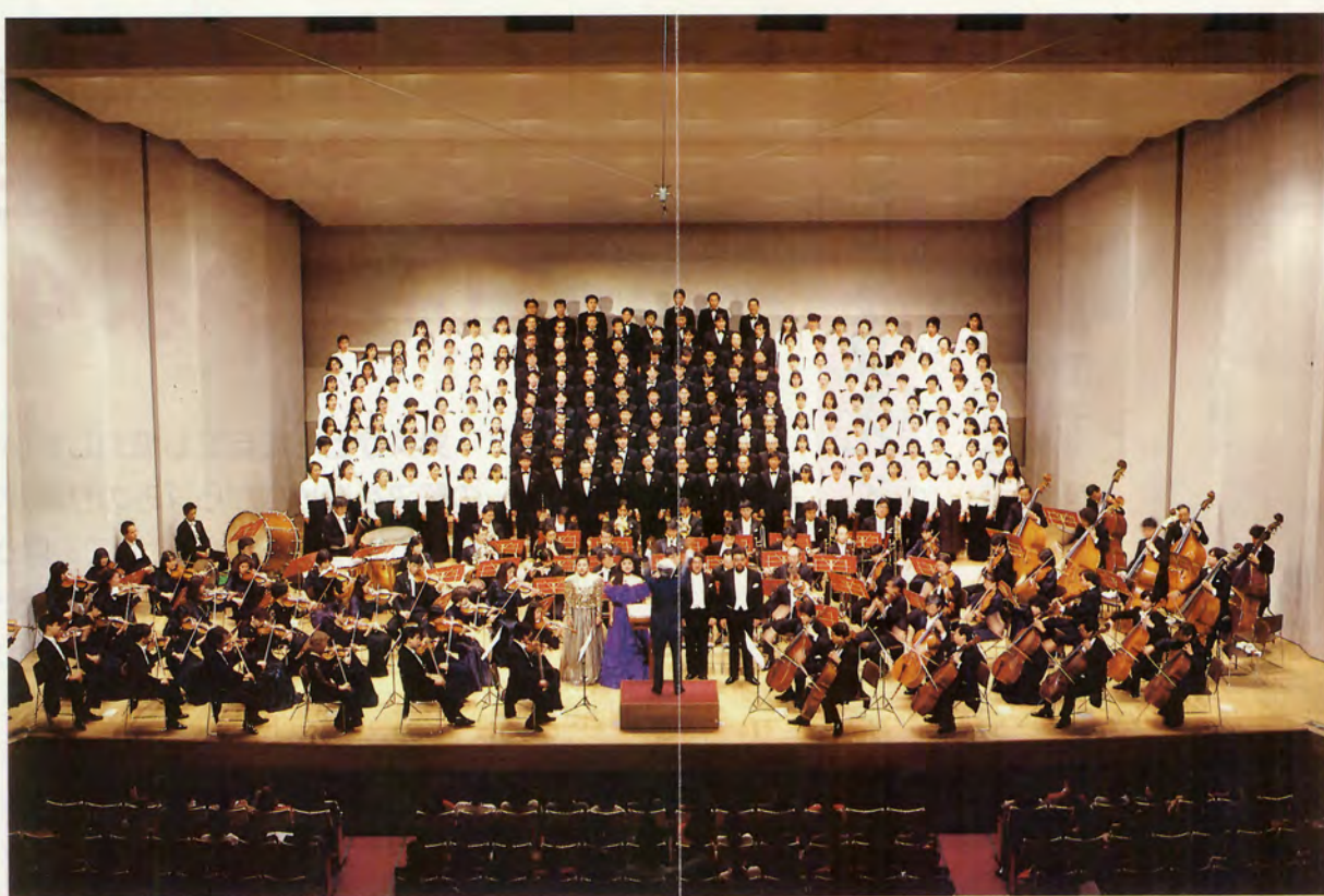
ゆとりと豊かさが実感できる県民生活の形成