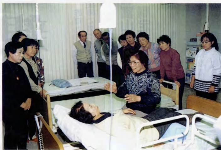
▲福祉カレッジでの研修風景

●福祉を支える人づくりの視点 富山県福祉カレッジは、一般県民の皆さんを対象に各種の講座を設け、福祉や介護への理解を深めているほか、ホームヘルパーや施設職員などを対象とした研修を実施し、サービスの向上を図っています。 開校から一年あまりで受講者は延べ一万人を超えました。今後は福祉人材の養成校のバックアップにも力を入れていく予定です。 ●高まる福祉への関心 一般県民の受講者の中で多いのは、介護技術の習得の必要性を感じておられる主婦の皆さんで、そのほとんどが「受けて良かった」と答えており、福祉への関心の高まりを強く感じています。