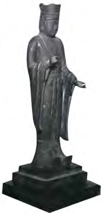
他県では、いずれも古墳群を芝生や散歩道でまとめてあるのに対し、本県では、

このように盛り沢山の遺跡、資料が一所にまとめようという計画で、縄文時代から近世にいたる郷土の歴史が一目でわかることになる。 『風土記の丘』の建設は、四十一年度から文部省が、放置されがちな遺跡を整備、保存し、文化財の散逸防止のために呼びかけたもの。 幸い本県には、古代の遺跡が全国的にも多いことから名乗りをあげ本県の誇りである立山連峰とそれに関係の深い立山信仰を中心に構想を練り、地元、立山町の大きな協力を得てようやく建設されることとなった。 予算の内訳は、国庫補助二千五百万円、特定財源一億円、県費五千五百万円、地元五千五百万円と合計二億三千五百万円の巨費を投じて二十四万七千五百平方メートルの巨大な敷地に今年度から建設に着手する。