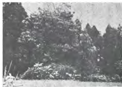
砺波市新町にある為景塚

このことについては小矢部市殖生の護国八幡宮に關係文書が三通もあり、下絵の本土寺過去帳にも明記されている。まさか親子二代とも同じ場所と討死することもあるまい。永正十六