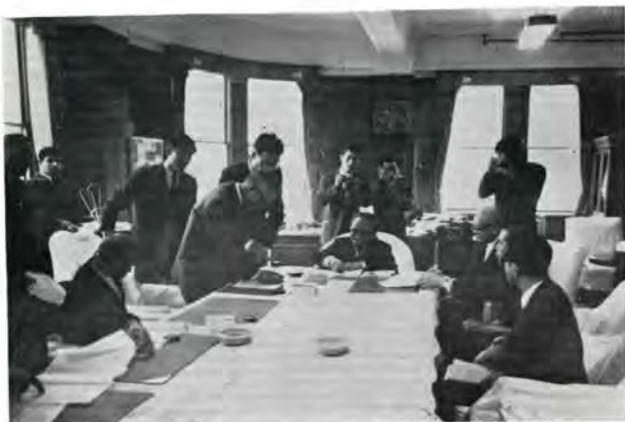
知事室で調印する地主代表

これは、富山—高岡間の交通マヒ緩和をはかろうと、建設省の進めているバイパスの建設を少しでも早めるため、県が用地買収に協力して調印のはこびとなったものです。富山—高岡バイパスは富山市金泉寺—高岡市