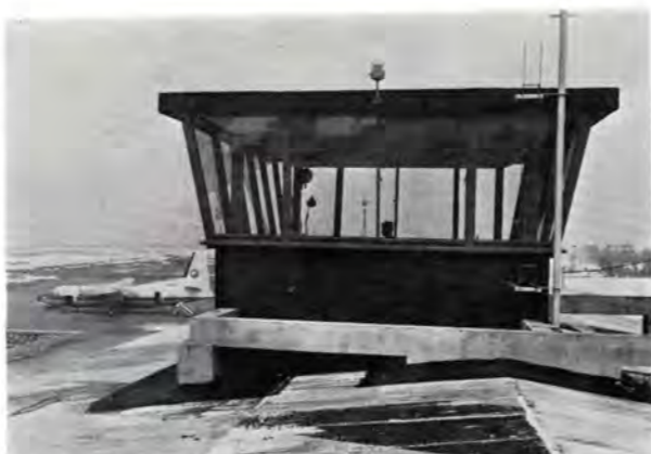
富山空港事務所屋上に建設された管制塔

四ツ屋の二十五キロで、すでに高岡市内で工事に着手しています。県では今回の富山市大塚、八ヶ山、高木、本郷地区二百六十六歳の用地買収にひきつづき他の地区についても用地買収交渉を進め、四十八年末には二車線で全線完成、さらに五十一年には四車線全線完成をめざしています。