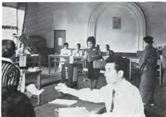
あなたの一票が大切

員になって取り返そうとするんでしょ う。(一同爆笑) 由井 選挙にお金がかかるとおっしゃい ますが、そんなにかかるとはとても信じ