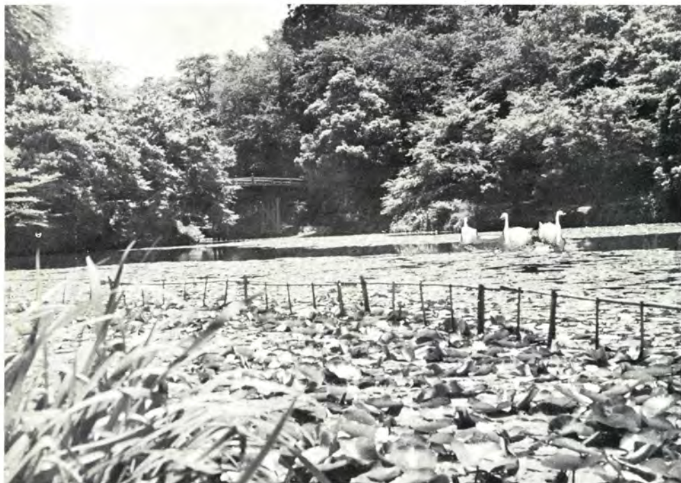
古城公園の名物「ハクチョウ」。向こう側は太鼓橋

42年10月に県定公園に指定されたことを機会に、この古城の静寂さを失なわないよう景観の保存が叫ばれている。