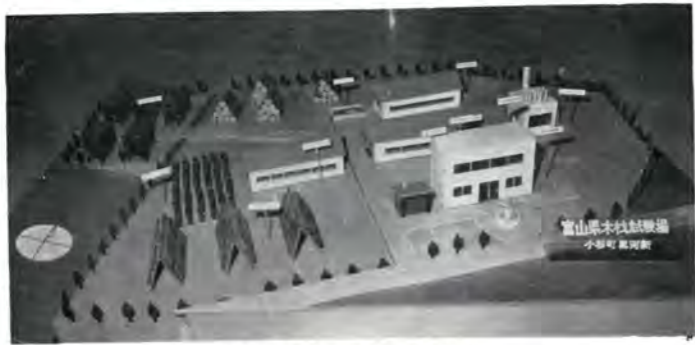
46年にはこのように（模型図）

大岡山ニエータウン（小杉町）に接近して建設が進められていた木材試験場は一部完成し、四月から発足しました。