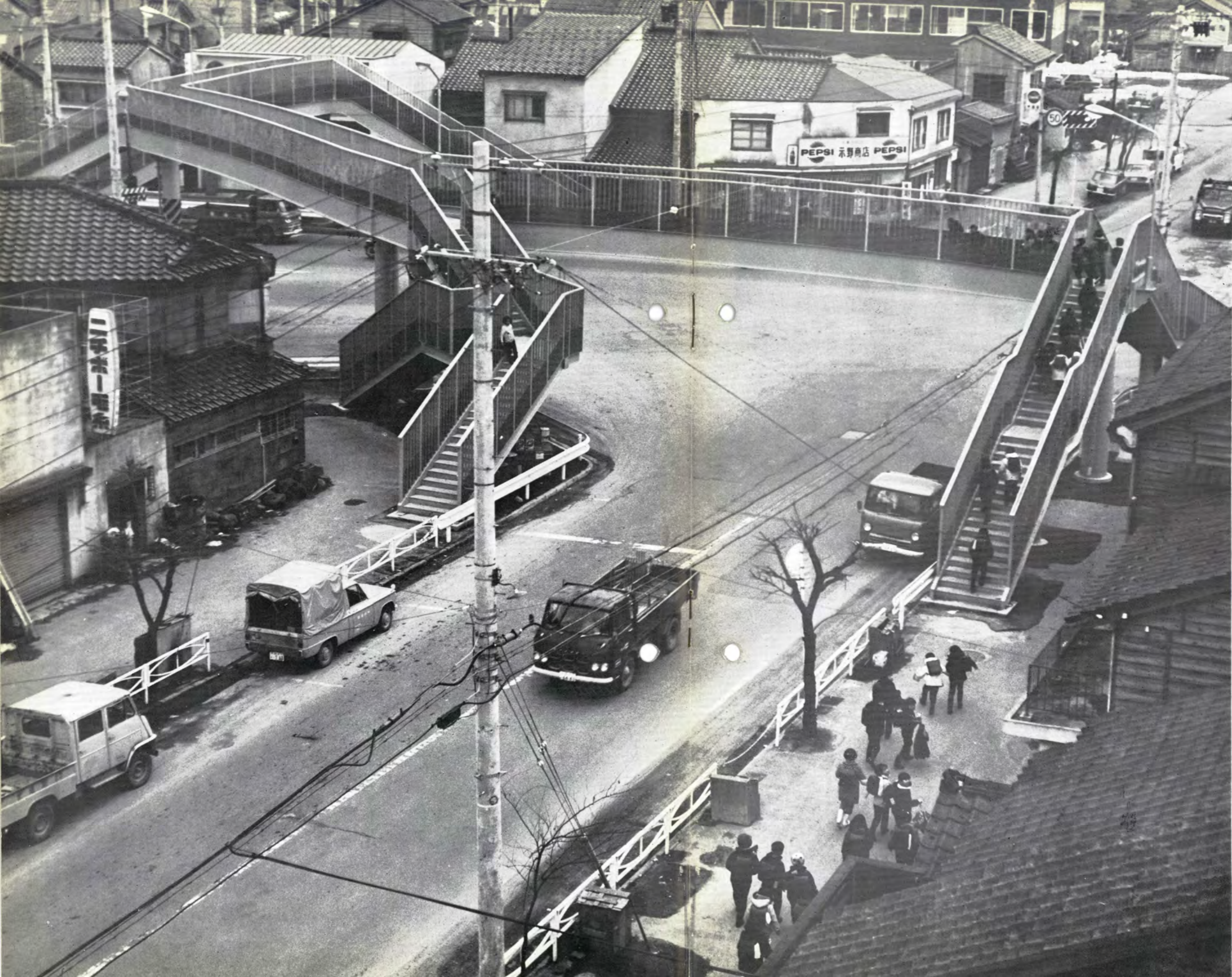
(写真は、富山市神通町五差路に完成した北陸一の歩道橋、長さ五十六・六メートル、巾一・五メートル)

ワァーイ 渡ろう 渡ろう 歩道橋を渡ろう 僕も私も、あなたも君も みんなで渡ろう 歩道橋を渡ろう