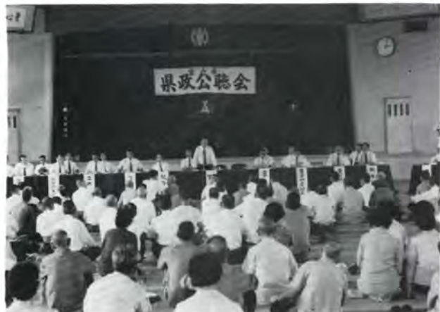
富山市水橋町での県政公聴会風景