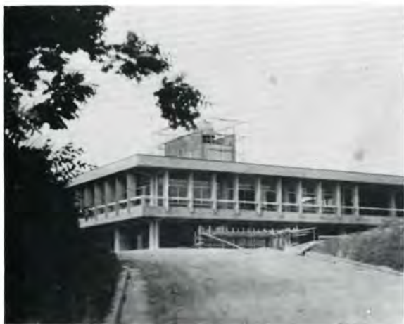
新しい県立図書館

新しい文化の殿堂、県立図書館が七月二十一日竣工しました。 新図書館は、富山市茶屋町の呉羽山公園風致地区に建設され、図書館にふさわしい静かな環境に二億一千万円が投じられ地下一階、地上二階で、中には三十万冊が収容できる大書庫などを備え、斬新な設計は全国にも誇るべきものです。この図書館は、近代的な設備のほかに、県下の中央図書館にふさわしく、資料館的性格を持つ図書館として日新月歩の技術革新に遅れないよう、資料と情報を整理し、各方面の利用に応じます。また郷土資料の収集、保管に重点がかけられるのもこの特色です。 先頃、旧図書館からの引越しも終わり九月二十二日の開館式を待つばかりとなりました。一般の利用は九月二十四日からとなっております。なお県視聴覚ライブラリーは、富山市五福県立工業高校理科教育センター内に引続き事務をとっております。