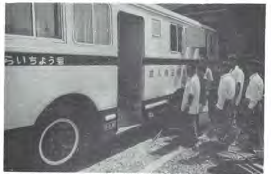
ガン検診車による検診

昭和四十二年の本県の交通事故による死者は五千九百七人、うち死者は百三十九人。この数字は年々増大しており、大きな社会問題になっていきました。ところが同じ期間に、がんで死亡した人は千三百三十二人と交通事故による死者数のほぼ十倍に達している事実をこそんじですか。このように、総死亡者数の十七・〇%を占め、死因別では脳卒中の二十六・四%に次いで第二位。また、年令階層別にみると四十五歳以上がトップを占め、この年令層の三人のうち一人ががんで命を落しています。 四、五十代といえは生活も安定し、社会的地位もでき、働き盛りで一家の大黒柱。その人ががんで倒れるということは社会全体にとっても大きな損失であります。