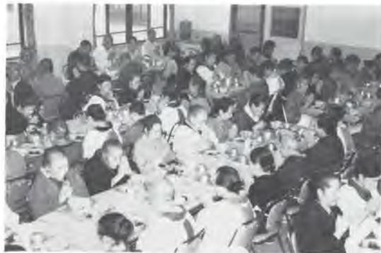
みんなで食べると食欲も進む

これなんかやはり、七十才以上の老人の方には医療費の全額国庫支出をしていただきたいものです。