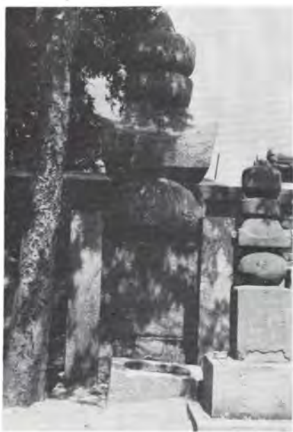
尼崎市にある佐々成政の墓

つづけること三年間、ついに秀吉の越中攻めとなる。はじめ成政は徹底抗戦するつもりであったが、秀吉の大軍を見て、とてもかなわぬと思い、ついに頭をそって降参した。 その結果、成政はゆるぎたて肥後国(熊本県)に転封せられるが、民政よろしきを得ず、地侍たちの大反乱にあい、周辺の諸大名の援助によって、ようやく鎮圧する。その失敗を謝罪するために大阪へ上る途中、尼崎にて死を賜わり、法園寺にて切腹したのである。年五十三才。墓は大小二基あり、小は古く、大は新しいようだ。小なるは高さ九十寸、大なるは高さ二・三尺、花崗岩で風化甚だしく、文字は全くわからぬ。法園寺は先年火災で全焼し、位牌も肖像画も御陽成天皇御哀悼の御宸筆も皆焼いてしまったのは、残念なことである。