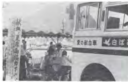
白ばと号による街頭献血

とどなたでも安全です。アメリカ、イギリス、ドイツなどでは一回の採血量が四〇〇～五〇〇CCといいますが、日本の一回二〇〇CCの採血からも安全性がわかります。また、採血前に医師が検診しますから、決して無理な採血をいたしません。同時に血液型もわかります。