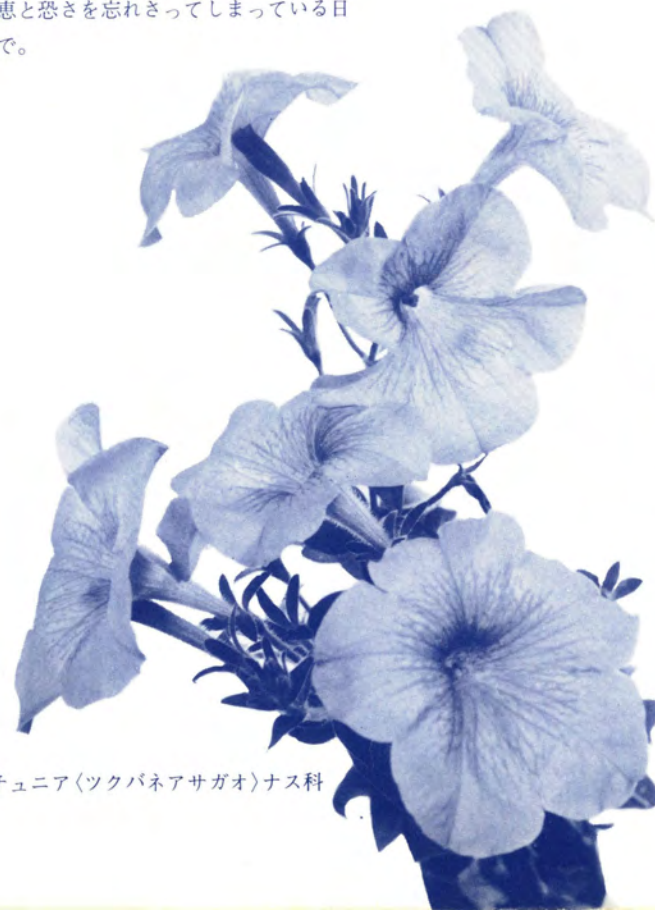
ペチュニア(ツクバネアサガオ)ナス科