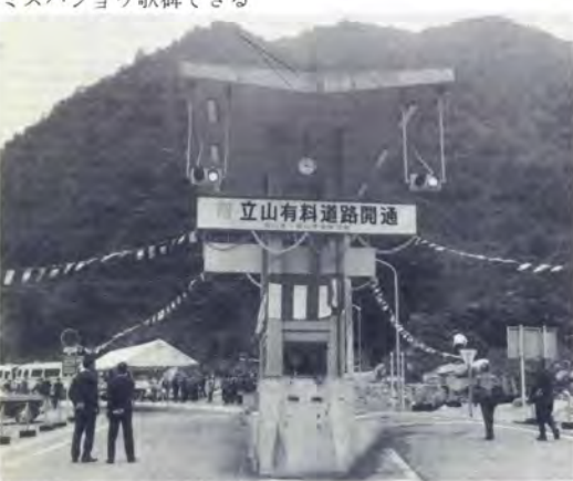
立山有料道路開通式

五月二八日 ミズバショウ歌碑できる 一昨年、全国植樹祭にご来県された天皇陛下が、城端町の縄ガ池に咲く県指定天然記念物ミスバショウの群生をご覧になってお詠み