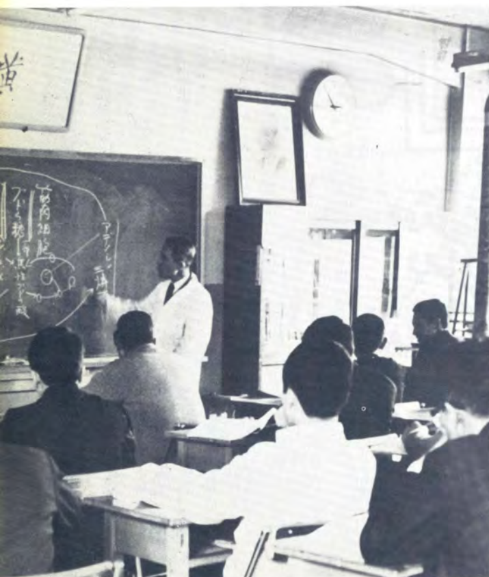
4. 新しい配置員をめざして、知識の取得基礎訓練をうける。ここにも女性の進出が。