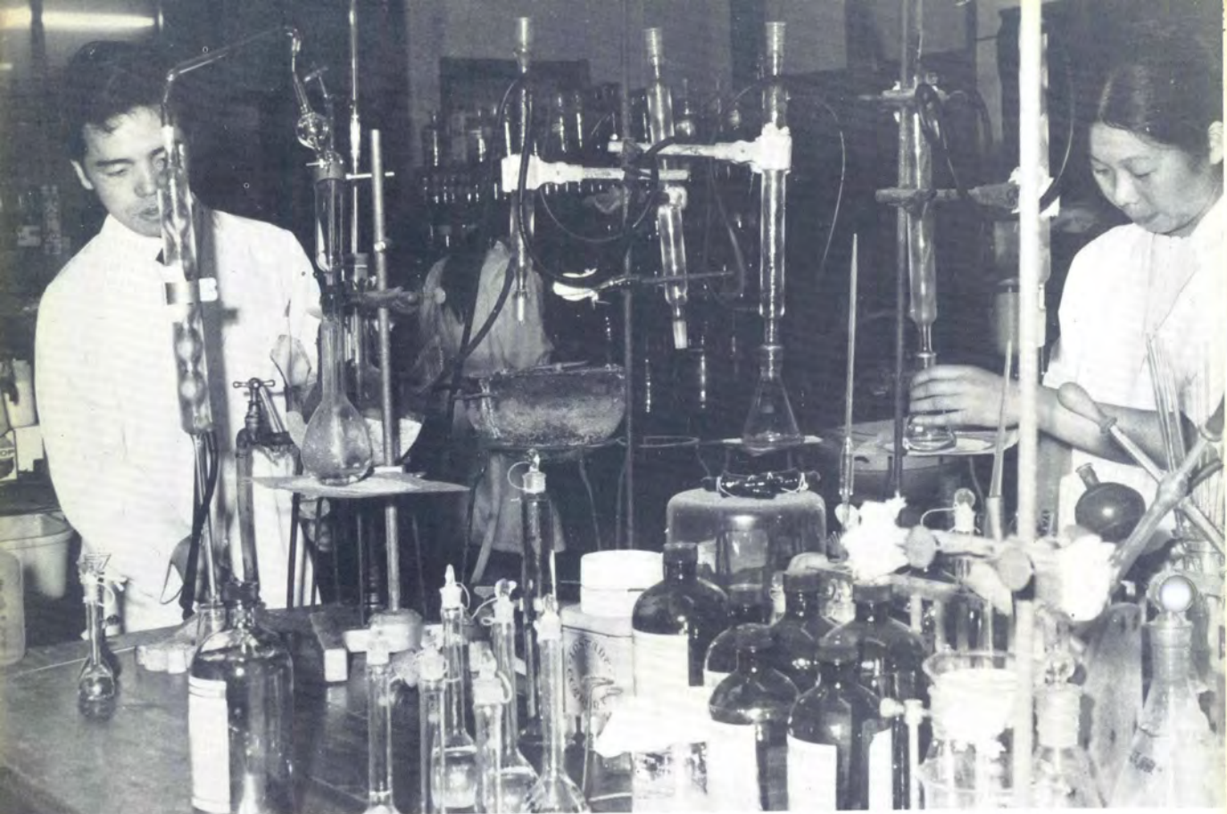
2. 職員の大半が薬剤師さん、常に研さん怠りなく指導・研究にあたる。

研究所のとなりにある薬業講習所は、配置員になろうとする人を対象に研修が行なわれるところです。資格を得るための条件として、また常に新しい知識を得るための再教育の場として、毎月行なわれています。