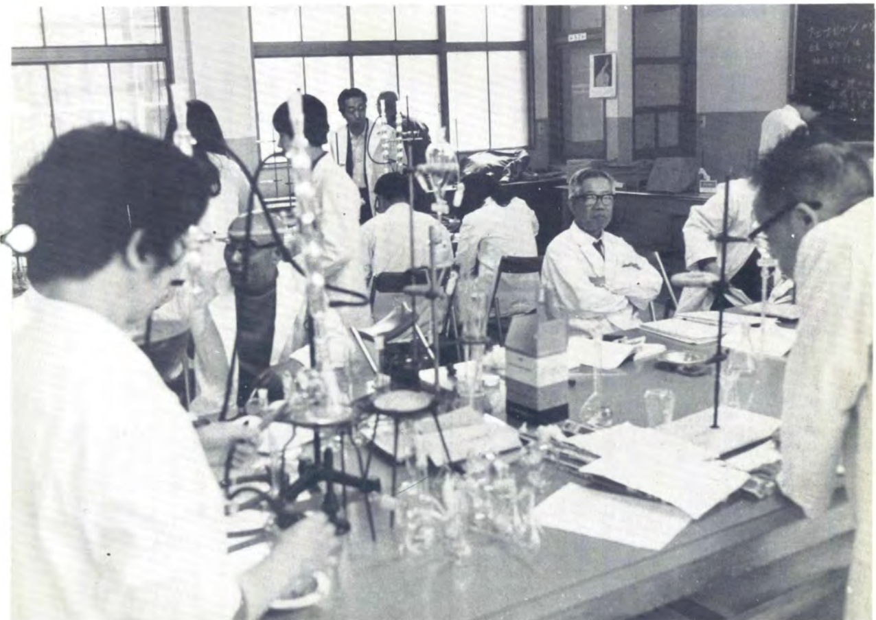
1. 自家試験室を利用する医薬品メーカーの人たち。真剣なまなざし、手つきも堂に入ったもの。