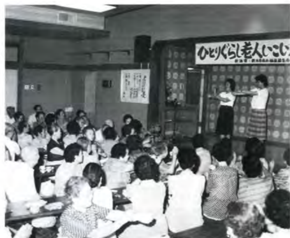
人生80年を生き生きとすごしたい

お茶をくむことが特性に合っている女性ならそれで良いのですが、全部の女性が得意ともしていないのにお茶くみしなければならぬのは差別だと思ってしまう。お互いに助け合って、その時々々に協同し、家事でも社会でもやっていくべきだということ