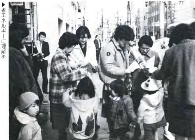
省エネルギーに理解を

瀋陽薬学院は中国に二つある薬学院のうちの一つで漢方薬専門科目を持ち、現在北里大学と学術交流を行っています。今回の代表団は、この北里大の訪問に併せ、全国的にユニークな和漢研究所を持つ富山医科薬科大学を視察し学術交流をすすめようと来県したものです。