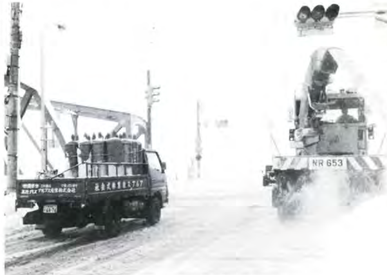
交通確保のために除雪車はフル運転

調査は県下全域の河川、湖沼、海域166か所で、鳥獣保護員、自然保護員等81名の調査員によって行われ、カモ類18種21,126羽、ハクチョウ類2種39羽の合計21,165羽が確認されました。この調査は昭和44年から全国一斉に行っているものですが、今回初めてコハクチョウ1羽が田尻池(富山市)に飛来しているのがわかりました。なお、今回調査で、ガン類は確認されていません。