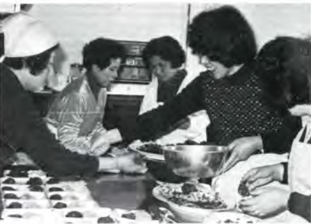
◀おはぎ作りのボランティアは楽しい

これからの老人問題とか自分 の老後のことを考えてみるのに は、ハダで問題に触れるわけで すからとても勉強になります。 朝倉 そうですね。施設にかか わるのが施設のためになり、 施設も女の力を認めてアテにし ていく。つまり女のためにもな るし社会のためにもなるわけで