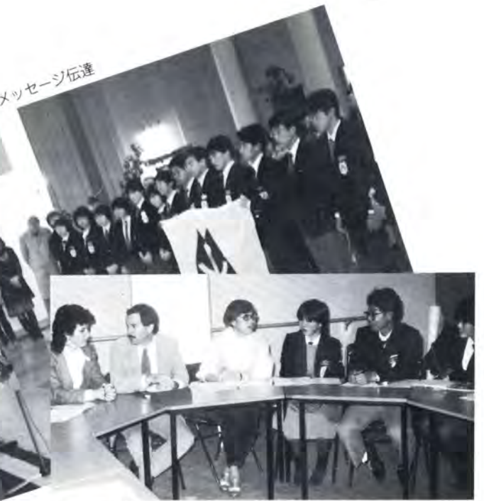
フランスの社会教育について話を聞く