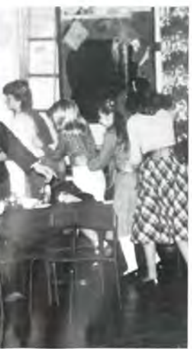
リーとゲームで交歓 (イギリス、ヤータレイ)