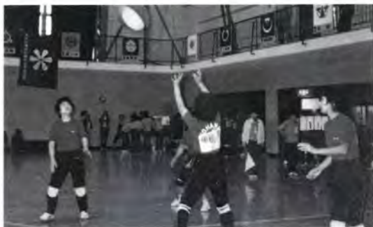
朝倉 先程のインタビューにも男女同権になったら女がお茶をくまなくなるというのがあります。

女は自分の力を強めていくことが大切です。そのためには、どうしたらよいでしょうか。亀谷 女性は、年々考え方が向上してきていると思うのですが、男性の考えはまだ保守的でなかなか女性と足並みをそろえて向上してもらえない。社会は男女ともに築いていくものなんです。女性が家庭に閉じこもらず社会に出ていくには、やはり男性の協力がいると思います。奥さんが外出したときちよつと茶わんを持っていくとか、フットンをあげるとか、少しぐらい家事参加してもらえたら。