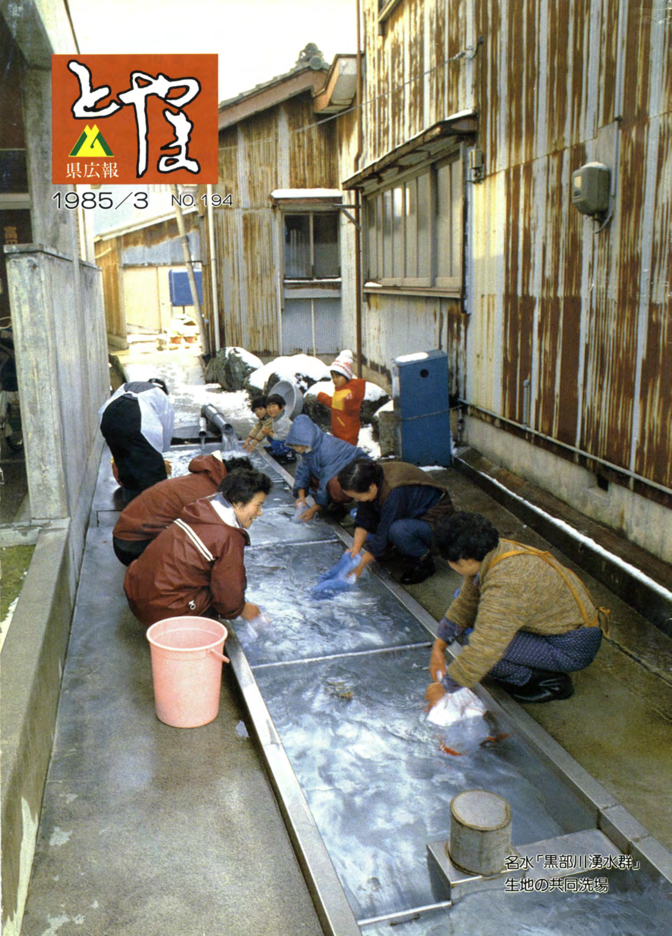
名水「黒部川湧水群」 生地の共同洗場