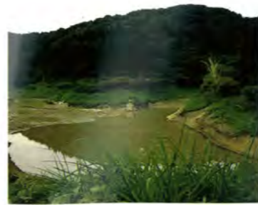
水辺の植物の多い殖生大池

一月二十日、京都で行われた都道府県対抗女子駅伝で、堂々十四位の成績をあげた富山県チーム。手に汗にぎるレース展開に、テレビに釘づけになっていた方も多いかと思えます。 雪国のハンデイを乗り越えて、越中女の底力を見せてくれた彼女たちはこのレースのために、陸上競技のみならず、ホッケー、ソフトボール、水泳と県内の様々なスポーツクラブから選ばれたものです。昨秋以来、五回の合宿や余暇を活用しての練習をつみ重ね、この混成チームは、強敵の他府県と互角のレースを見せてくれました。 ほとんどが中学、高校の十代の選手たち、将来がとっても楽しみです。