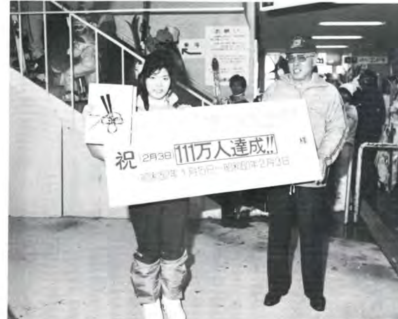
今冬も Gondolaski 場は大人気