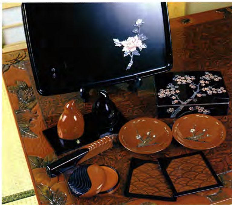
贈答用に需要の多い漆器

製品の開発、販売に力を入れており、着実に需要も伸びてきています。 高岡漆器についてのお問い合わせは、伝統工芸高岡漆器協同組合(〒933 高岡市開発本町一の一 高岡地域地場産業センター内 ☎0766(22)2097)まで。