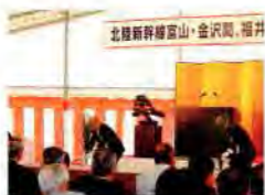
①高岡市、金沢市、福井市で起工式が行われ、高岡市では沿線関係者など約100人が参加し、工事の安全を祈った。