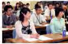
第一期生は39人。真剣な表情が、未来塾への期待感を物語る。(開校式の様子。7月3日、情報ビルにて)