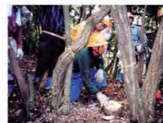
コナラの間伐などの森林整備を行うボランティアの皆さん

により、クマの出没が予測される場合には、注意報や警報を出して、パトロールの強化や児童・生徒の集団登下校を行う。 ②被害防除 ◎奥山地域…本来のクマの生息地であるため、入山者の自己防衛意識の啓発を図る。 啓発例：ラジオ、鈴の携行など ◎里山、人里・街地域…関係機関との連携を図り、定期的なパトロールなどを行う。また、クマの生息に関する正しい知識を提供し、クマを引き寄せないための注意点などの普及啓発に努める。 啓発例：人家近くの果樹や不要な農作物の管理など ③出沒対策 ◎奥山地域…入山者に対し、注意喚起を行う。 ◎里山、人里・街地域…檻を設置し、捕獲した場合は、原則として奥山地域に放す。人身被害が発生するおそれのある場合など、やむを得ない場合には、銃器により捕獲する。 ④クマの生息環境管理 人とクマの「棲み分け」を図るため、人の生活域にクマを誘引しないようにする。 対策例：里山地域の除伐、下草刈り、不要な農作物の管理など 中長期的には、他の生物にも配慮しながらクマの生息に適した多様な森づくりを進める。 県民による多様な森づくり ツキノワグマをはじめとする野生生物との共生には、生物の保護管理と多様な森づくりを併せて考えていくことが必要です。 多様な森づくりに関しては、森づくりガイ