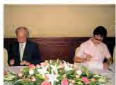
③本年10月下旬の開設に向け、石井知事と上海航空代表が覚書を締結した。