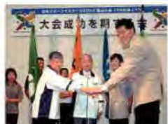
②出場する競技団体の代表者ら約200人と、大会の成功を誓った。