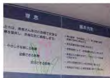
患者の意思を重視した信頼される医療の提供が重要なテーマとなっている。