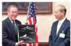
②米国オレゴン州との友好提携15周年を記念してクロンガスキー州知事らの訪問団が県庁を訪れた。