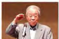
③「文化の力」と題して河合長官の講演やパネルディスカッションが行われた。