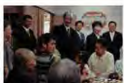
④秋篠宮さまが記念式典出席のためお成りになり、富山型サービス施設などを視察された。