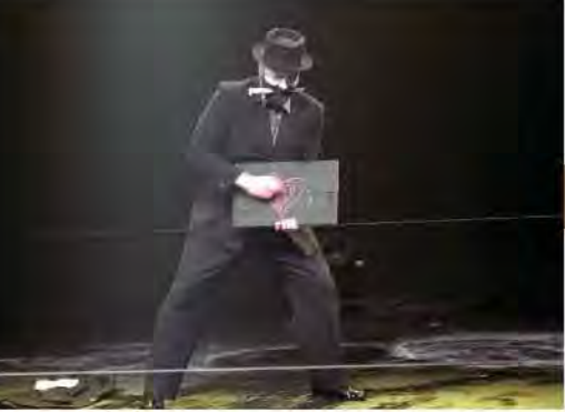
主人公を女性から男性に置き換えた劇団アへの「ミスター・カルメン」

メリメの名作「カルメン」をもとに、愛と嫉妬の物語を自由と隷属という視点でとらえ、ビジュアルを駆使した独特の表現方法で描いた話題作。1989年結成の劇団アへは、サント・ペテルブルグを拠点に、その活動は舞