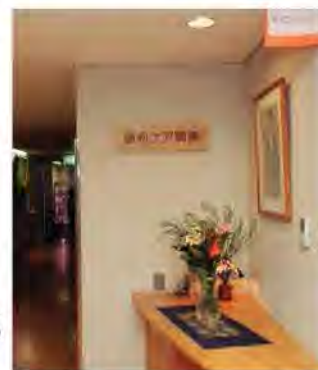
緩和ケア病棟では、患者の生活の質の向上が優先される。