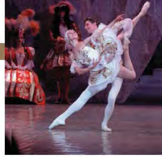
おとぎ話の世界をそのまま再現したシベリア・ステート・バレエの「眠れる森の美女」

誕生日の祝いの席で呪いをかけられ、眠り続けるオーロラ姫が王子のキスで目を覚ます。ファンタジーに溢れる豪華絢爛なバレエを、欧米での公演が主だったシベリア・ステート・バレエが日本初公演でお