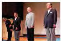
①石井知事がクールビズ・ファッションショーに出演し、環境に配慮した生活様式を提案した。