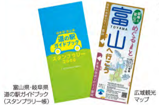
富山県・岐阜県道の駅ガイドブック(スタンプラリー帳) 広域観光マップ