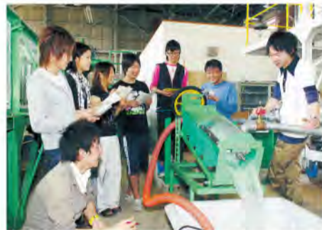
富山県の産業遺産である螺旋水車を活用したマイクロ水力発電システムの開発

ポイント1 時代の要請に 応える新学科 環境の世紀といわれる21世紀。地球温暖化やオゾン層の破壊などの「地球規模」の環境問題は、廃棄物や水・大気・土壌環境の汚染などの「地域」の環境問題と複雑に関連しています。 このような問題の解決には、廃棄物を出さない資源循環のための技術開発、汚染された環境の修復、自然生態系と調和した社会基盤の整備、循環型社会をめざした環境政策や企業経営など、地域における環境技術の開発とそれを担う人材の育成が極めて重要です。 県立大学では、こうした時代の要請に応えるために来春4月に「環境工学科」を開設。短期大学の「環境システム工学科」が、4年制の「環境工学科」として生まれ変わります。