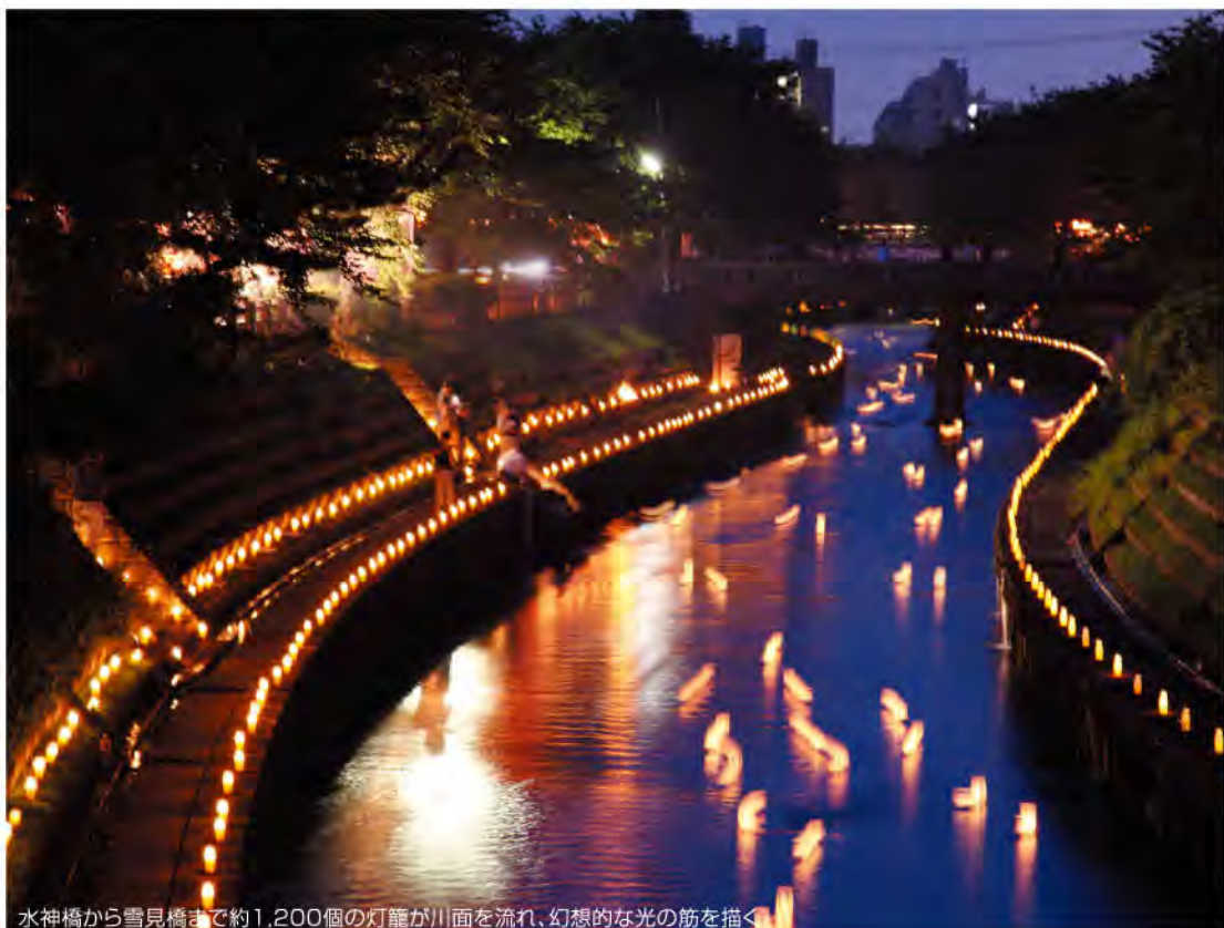
水神橋から雪見橋まで約1,200個の灯籠が川面を流れ、幻想的な光の筋を描く