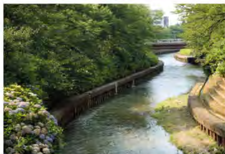
川面に並木の葉影を映して流れるいたち川