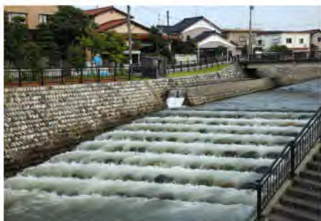
通称「どんどこ」と呼ばれる流れ