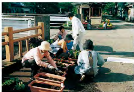
水辺の環境保全活動