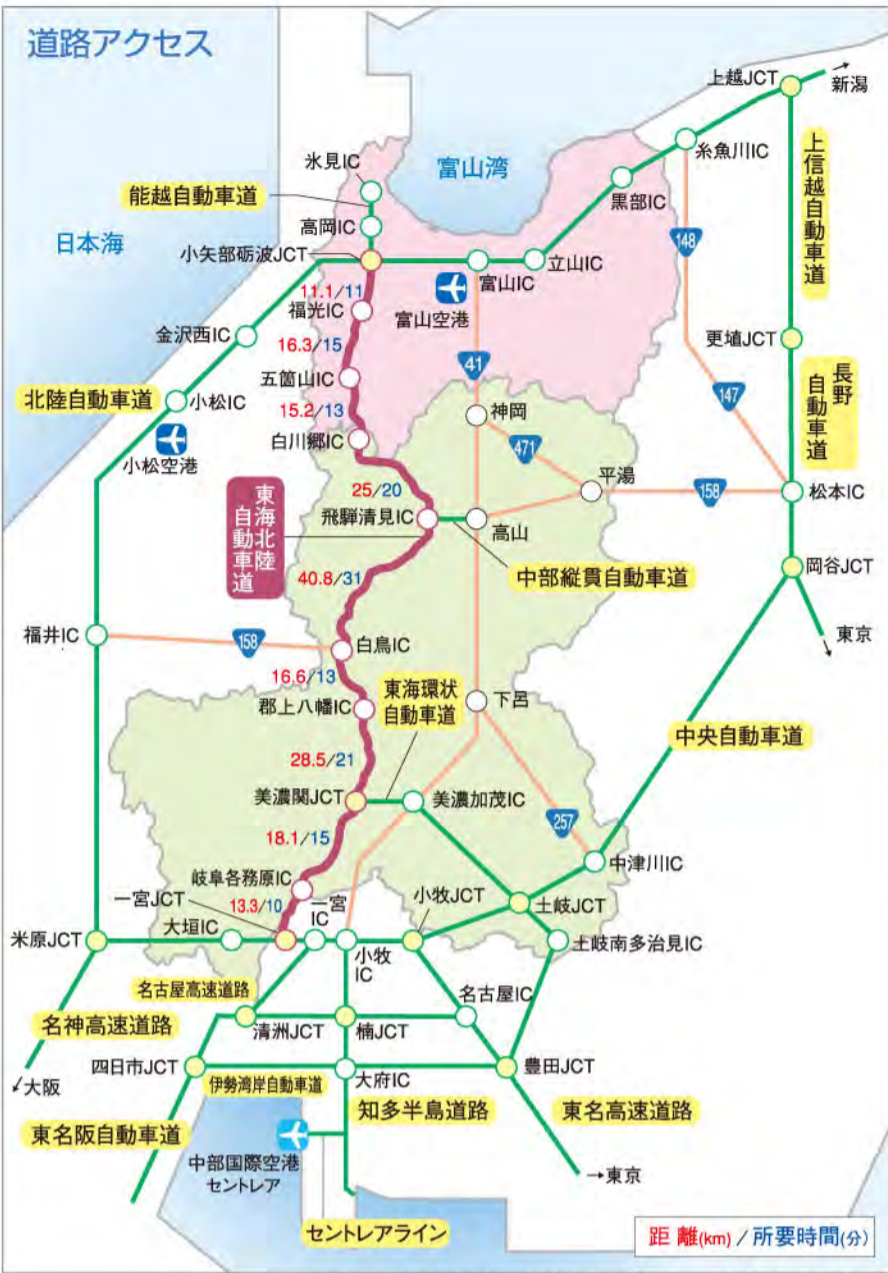
※所要時間はあくまでも目安であり、交通事情により変わる場合があります。

開通後、東海地域から富山を訪れる観光客もどんどん増えており、新たな出会いや交流を生み出す東海北陸自動車道に、地域活性化への期待と可能性が大きくふくらんでいます。