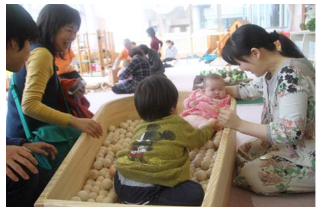
県産材遊具の導入 （地域子育てセンター（氷見市））