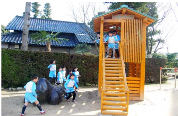
県産材こどもの城づくり事業 （ちゅうりっぴ保育園（砺波市））