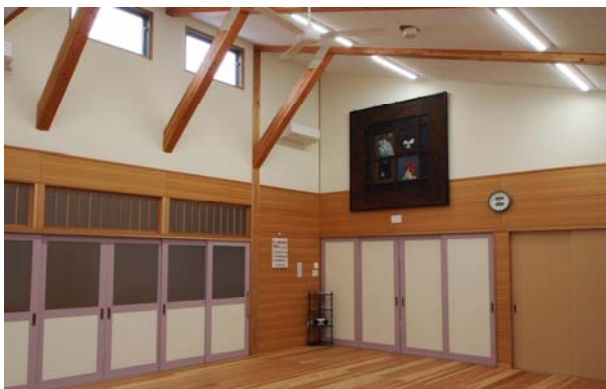
公共建築物等県産材利用促進モデル事業 （手崎ふれあいセンター（射水市））