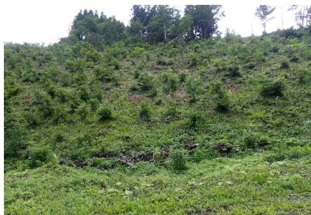
R1 5年経過後生育状況