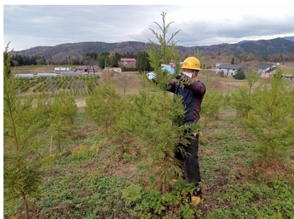
植栽した母樹の剪定

生育期間が短く、低コストで大量生産が可能となる挿し木苗生産に向け、県魚津採種園で採穂林整備のために植栽した母樹の剪定を行いました。