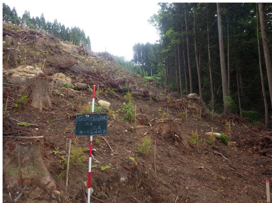
朝日町山崎蛇谷地内