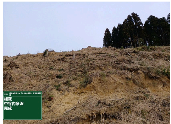
氷見市中谷内地内