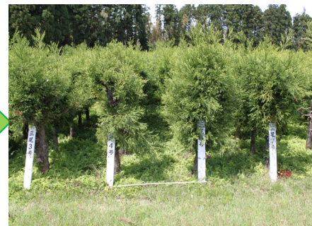
採穂林のイメージ