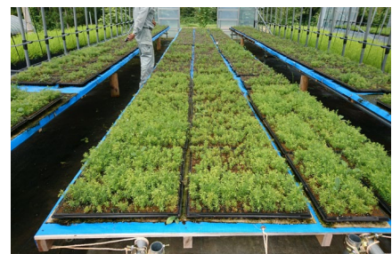
優良無花粉スギ「立山 森の輝き」のセル苗の生産状況

森づくりプランに基づき、優良無花粉スギ「立山 森の輝き」の苗木を生産。また民間生産者に対し、コンテナ苗のセル苗を生産・指導をしました。