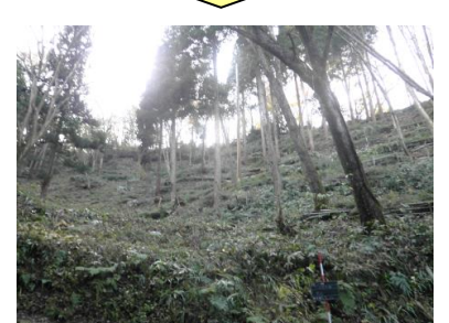
スギ人工林に拡大・侵入した竹林を整理