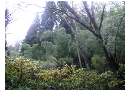
【侵入竹林整理】 (魚津市金山谷 地内)