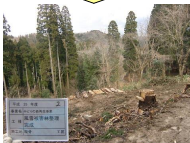
台風や積雪による被害を受けた人工林を整理