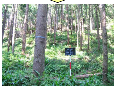
手入れが行き届かず、過密になった人工林を整理