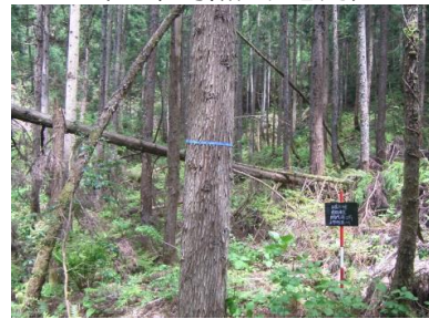
【過密人工林整理】 (上市町黒川 地内)