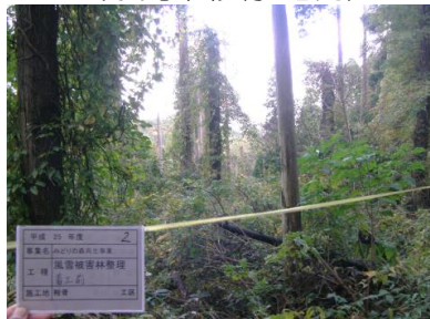
【風雪被害林整理】 (氷見市鞍骨 地内)