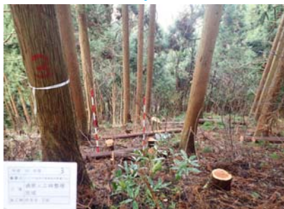
手入れが行き届かず、過密になった人工林を整理