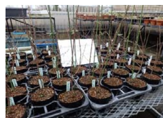
全国植樹祭において、天皇皇后両陛下がお手播きされたエドヒガン、タブノキ、ヤマザクラ、マルバマンサクを育成。順次、記念樹として配布予定。