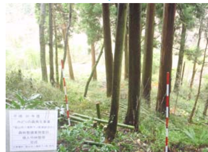
スギ人工林に拡大・侵入した竹林を整理