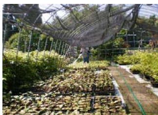
ボランティア団体等の協力により苗木を育成