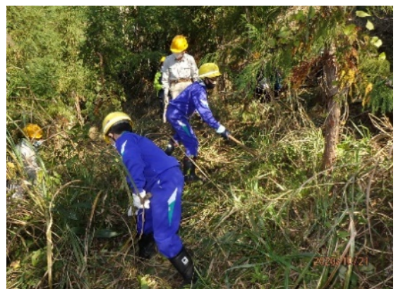
【富山地区林業研究グループ協議会婦中支部】 地元小学生の林業体験 (富山市婦中町大瀬谷地内)