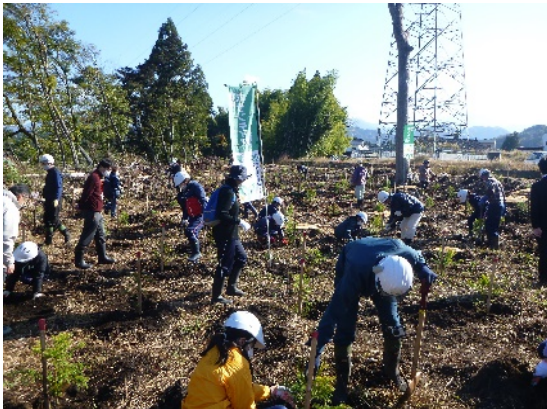
【白萩西部地区自治振興会】 地域住民と地元小学生による植樹 (上市町湯上野地内)