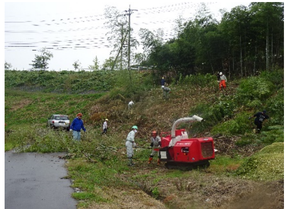
【保内里山再生整備の会】 竹林整備と竹のチップ化 (富山市八尾町保内地内)