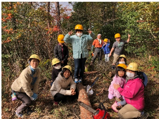
【びなっこ会】 木とのつながりを知る薪づくり (富山市婦中町吉住地内)