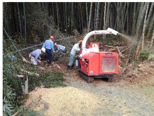
【なめりかわ森づくりクラブ】 竹林整備と竹のチップ化 （滑川市中野地内）