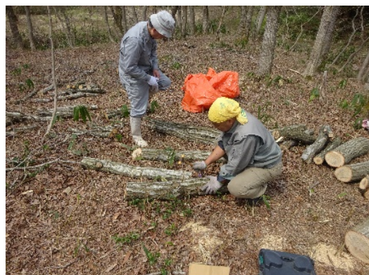
【SOGO（そうごう）】 里山林の整備とキノコの植菌 （高岡市福岡町沢川地内）