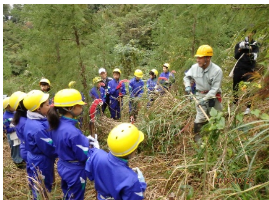
【富山地区林業研究グループ協議会婦中支部】 地元小学生の林業体験 （富山市婦中町大瀬谷地内）