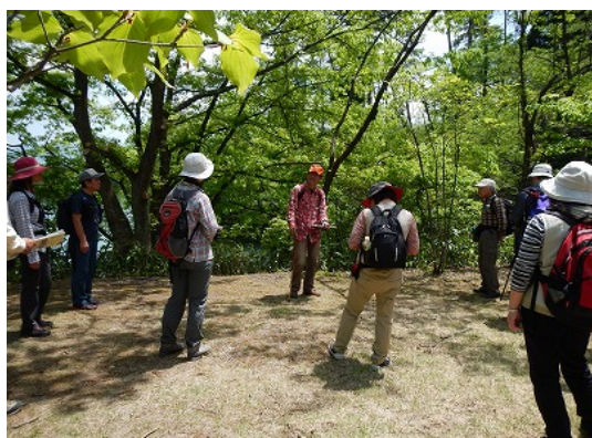
【NPO法人森林総合支援センター】 とやま森林浴の森での森林教室 （南砺市桜ヶ池外5箇所）