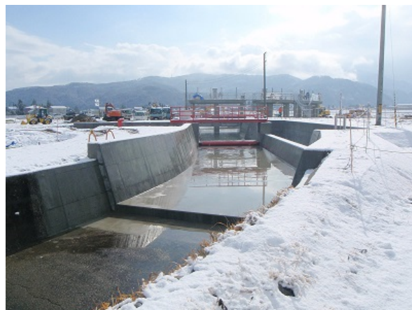
〔庄西幹線用水（砺波市中野地内）〕

庄西幹線用水路にて施工中の小水力発電用の管路において、漏水試験を行っている際の写真です。管と管の継目に水压をかけ、染み出しがないか確認しております。