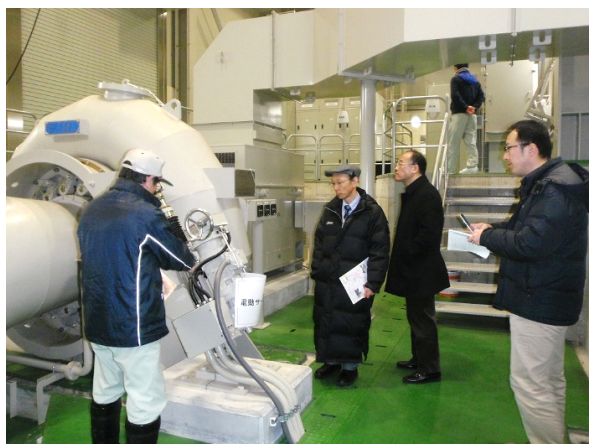
〔山田新田用水発電所見学（南砺市殿地内）〕

山王川用水路に係る工事では、県職員と各工事現場代理人により、月に1度安全協議会を開催しています。お互いがアドバイスをし、安全な工事が行えるよう調整しています。