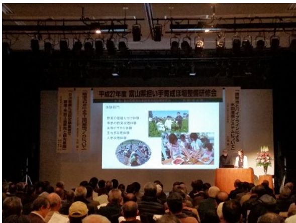
〔富山県ほ場整備研究会（砺波市文化会館）〕

2/23に行われたほ場整備研修会では、約280名の出席者が、ハード事業と連携した一億円産地づくりや六次産業化などのソフト対策について興味深く聞かれておりました。