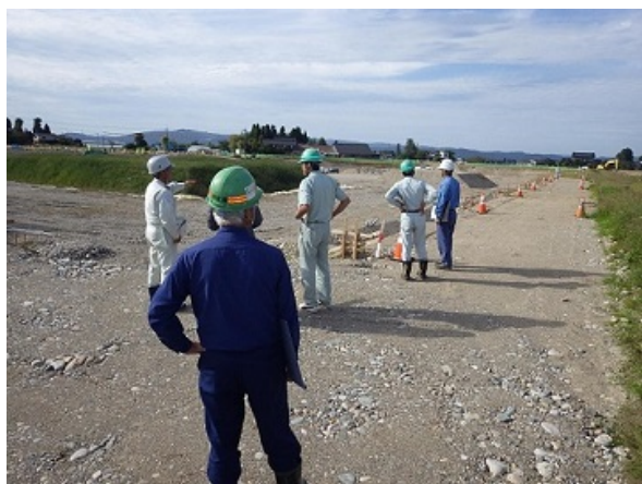
〔山王川用水路・調整池（砺波市小島地内）〕

10/30～11/2にかけて行われた井波帰農塾の一コマです。塾長より赤ズイキの皮むきの方を教わり、黙々と作業されています。乾燥した後、酢物や白和えとして料理されます。