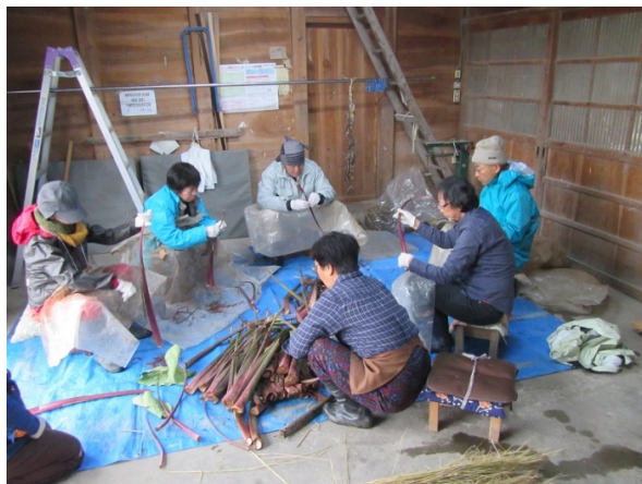
〔井波帰農塾（南砺市飛騨屋地内）〕

2/23に行われたほ場整備研修会では、約280名の出席者が、ハード事業と連携した一億円産地づくりや六次産業化などのソフト対策について興味深く聞かれておりました。