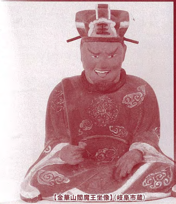
【金華山閻魔王坐像】(岐阜市蔵)