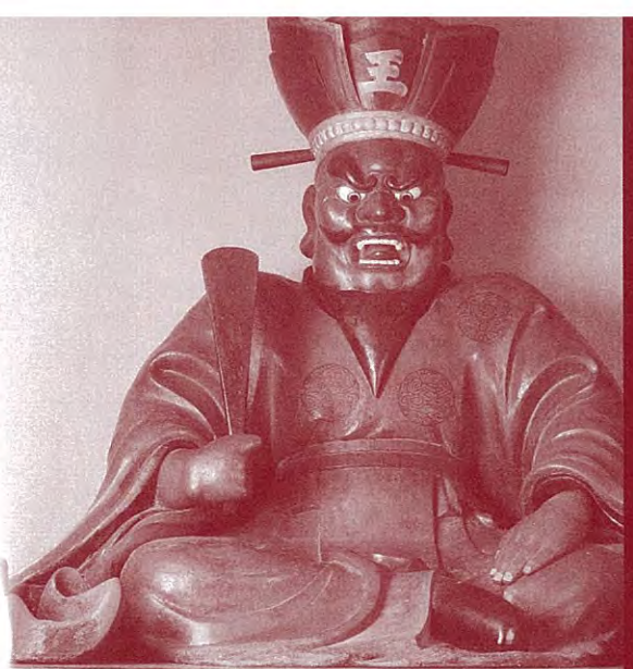
【木造閻魔大王坐像】(芦峯寺閻魔堂蔵・県指定文化財)

亡者の地獄行きを判定する閻魔大王は、生前の善悪の内容を裁くと信じられた。立山と閻魔、どのように関わりながら伝わってきたのか…。