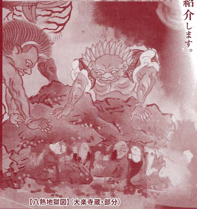
【八熱地獄図】(大楽寺蔵・部分)

立山と地獄、まさに一対の存在として同一視されてきた山岳信仰の歴史的過程を紹介します。