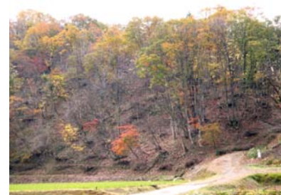
整備後の見通しが良く、明るい里山