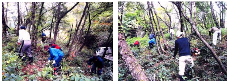
クマ、イノシシなどの野生動物との棲み分けを目指し、地域住民の手で見通し良く整備