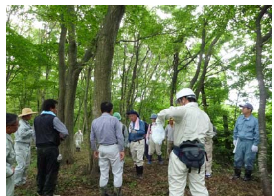
「里山リーダーセミナー」における里山の利活用方法等の指導