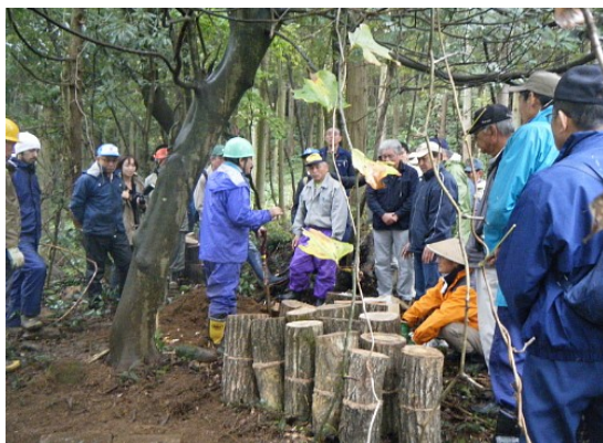
「里山リーダーセミナー」におけるキノコ短木栽培の指導