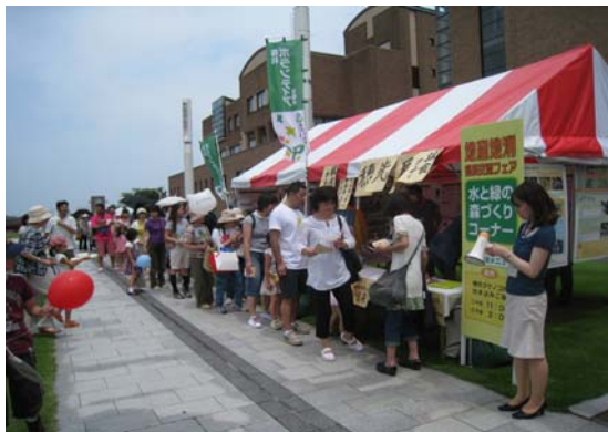
穂先タケノコの炊き込みご飯の試食提供