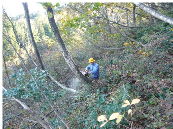
道路沿線にある枯損木を除去しました。