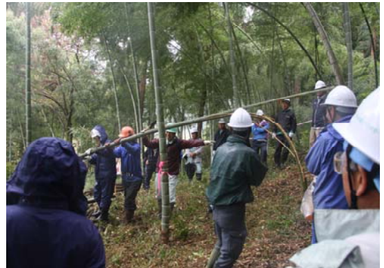
「かぐや姫の里の集い」における竹林伐採等の技術講習