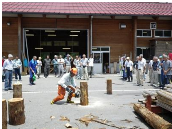
「里山リーダーセミナー」における機械操作技術の指導