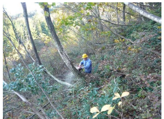
道路沿線にある枯損木を除去しました。

事業実施地区 29地区（12市町） 除去量 2,523m 3 事業主体 県、市町村