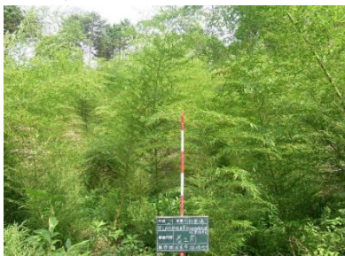
整備前 タケが再生し、見通しの悪い里山