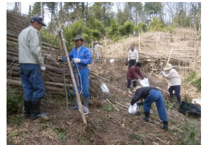
整備後 再生竹が整理され、サクラが植栽された明るい里山