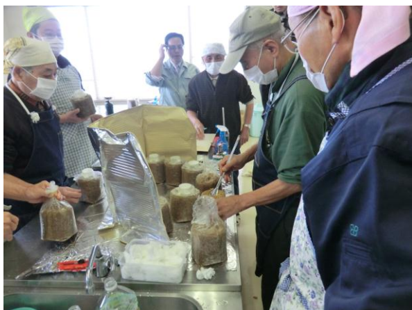
竹資源ネットワーク講習会における「竹オガ粉によるきのこ菌床づくり」の指導