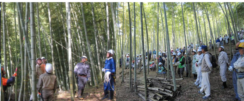
「かぐや姫の里の集い」において、竹林の安全な整備のための技術講習、理想の里山づくりの事例を紹介