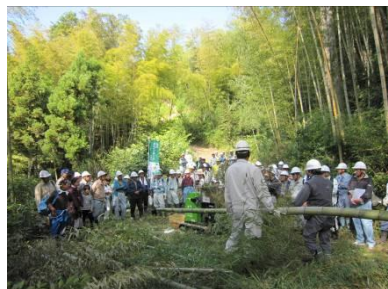
タケノコ掘りやサクラの植樹など、美しい里山を再生するための様々な活動を実施