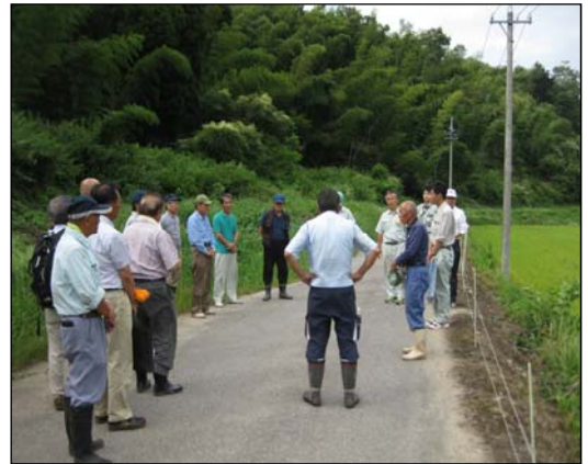
「里山リーダーセミナー」において、各地域のリーダーが里山利活用のために他地域の取り組みを見学し、意見交換を実施