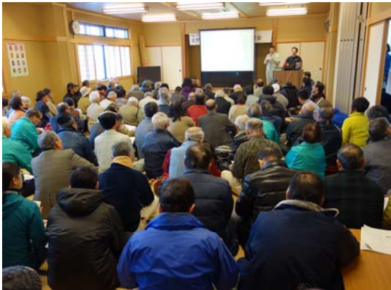
竹資源ネットワーク講習会にて、取り組みや活動方法のあり方等を紹介