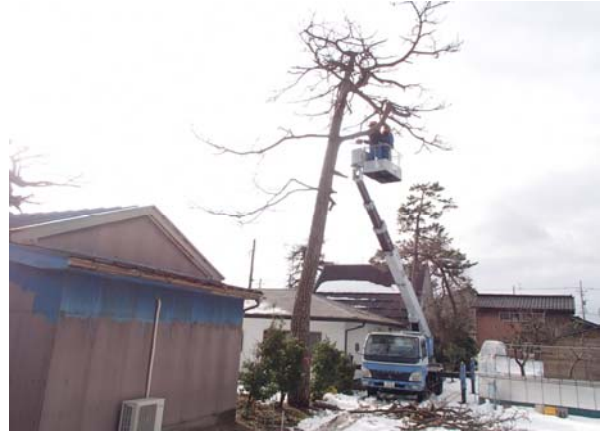
被害対策重点区域内での伐倒駆除 (富山市四方・草島地区)