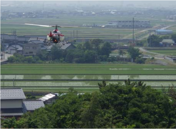
無人ヘリによる薬剤散布 (入善町飯野地区)