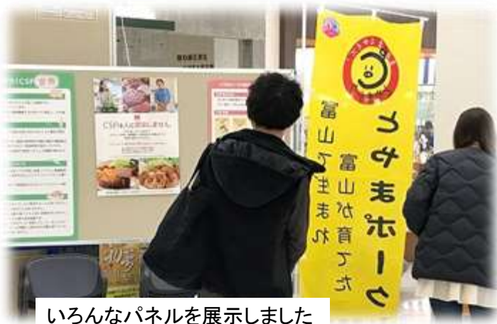
いろんなパネルを展示しました