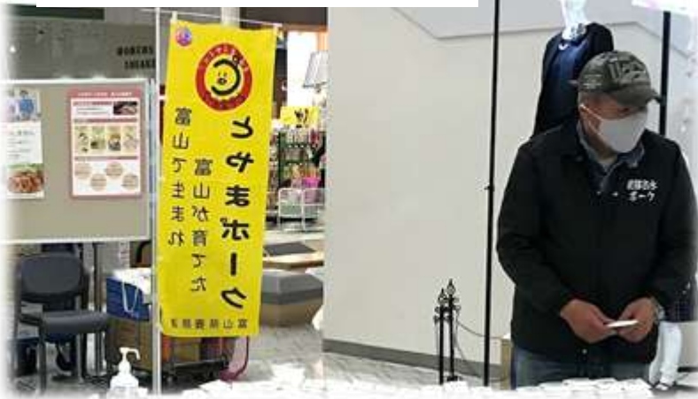
生産者の方も参加してくださいました