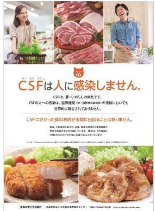
当日掲示したポスターです