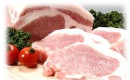
安全でおいしいとやまポーク