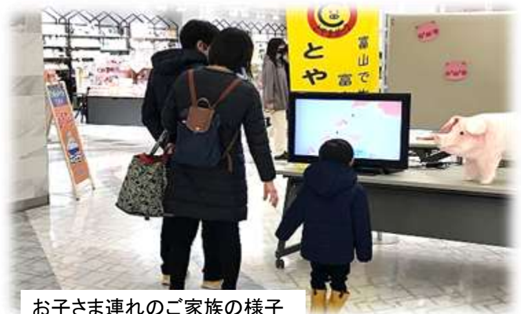
お子さま連れのご家族の様子