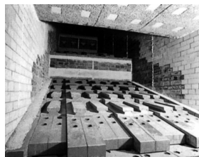
階段式高速燃焼ストーカー

焼却炉2基で1日約60トンのごみを焼却処理しています。発生する煙は、活性炭とバグフィルターというろ過装置で処理することによって、ダイオキシンなどの有害物質の発生を抑えています。また、灰を薬品処理して無害化しています。