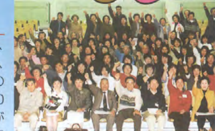
国体ボランティア「あいの風メイト」の皆さん(冬季大会の基礎研修にて)