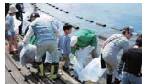
みんなできれいにせままいけ大作戦

県内の海岸に漂着するごみの約8割が県内で発生し、河川の流れを通じて流れ着いたものといわれています。このため、美しい海岸を守っていくためには、海岸部の地域だけでなく、山や街から海に至る広範な地域での活動が必要です。県では、毎年6月から9月にかけて、地域の住民が一体となって取り組む県土美化活動「みんなできれいにせままいけ大作戦」を県内全域で開催しています。