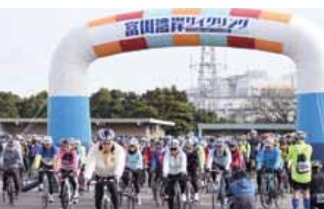
富山湾岸サイクリング2019

県では、湾クラブへの加盟を契機として、富山湾の美しい景観を楽しむことができる「富山湾岸サイクリング」の開催などサイクルツーリズムの推進、国内最大規模のヨットレース「タモリカップ」や日本初となる「極東杯国際ヨットレース」の開催などによるマリンスポーツの振興を進めています。また、民間主体による応援組織「美しい富山湾クラブ」が設立され、官民連携して富山湾の魅力を発信しています。