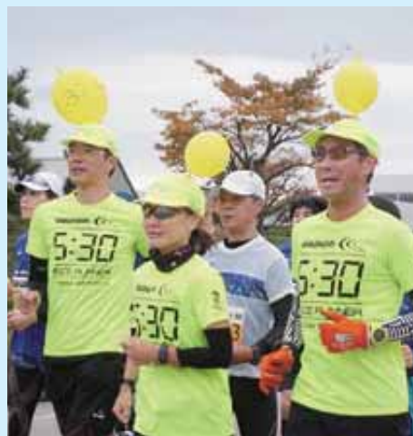
ペースランナーとしての活躍（富山マラソン2018）

第5回の富山マラソンは今年27日に開催。今年も連絡会から25名がペースランナーを務め、参加ランナーの走りをサポートします。