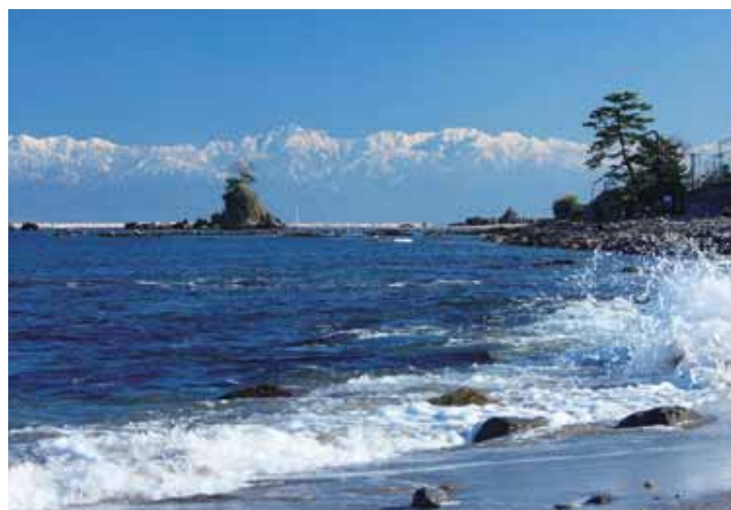
雨晴海岸から望む立山連峰

「世界で最も美しい湾クラブ」とは? ユネスコが支援する非政府組織(NGO)。1997年に設立され、フランスのヴァンヌ市に本部を置く。世界遺産のフランス・モンサンミッシェル湾、ベトナム・ハロン湾など、世界の44湾(26カ国・1地域)が加盟し、湾を活用した観光振興と資源の保全を目的に活動。