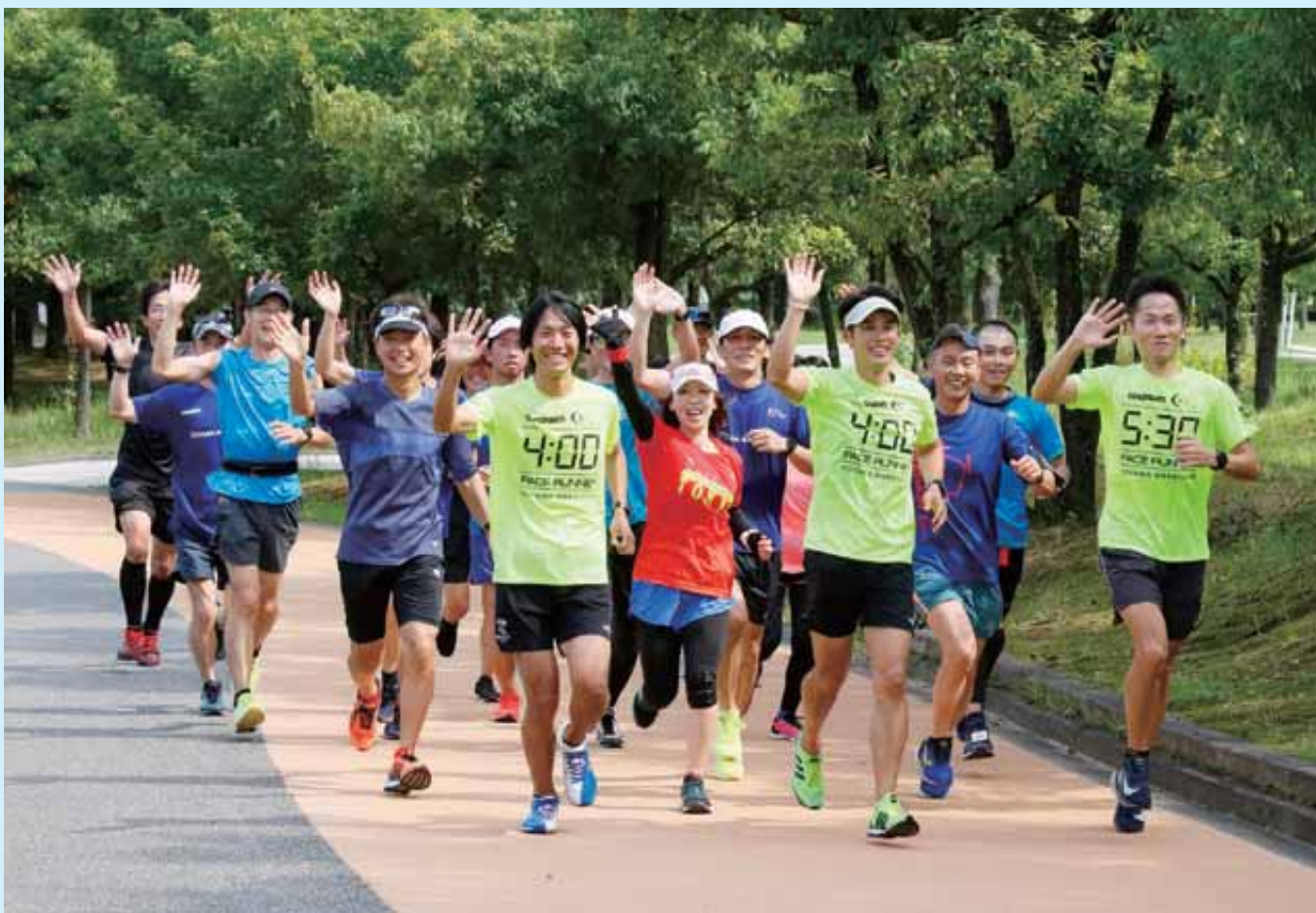
9月1日、富山県総合運動公園クロスカントリーコースで行われた練習会。約200名の参加者がそれぞれの目標タイムで走り、交流を深めた。