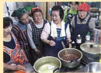
「伝承の匠」による料理実演

「とやま食の匠」とは 特産品の生産や、郷土料理、県産食材を使用した加工食品や創作料理について優れた技術・技能を有する方(団体)を認定しています。