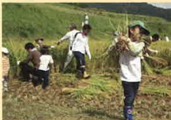
農山村での農作業体験

●農林漁業等体験者数(延べ人数) 49,400 人 (H25) → 54,000 人 (H33)