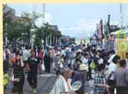
地産地消県民交流フェア