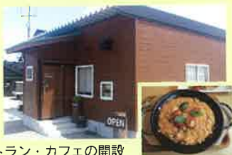
農家レストラン・カフェの開設