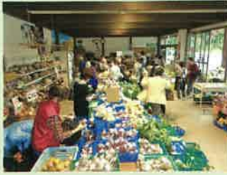
直売所における地産地消の推進

●直売所・インショップ販売額 28.7 億円 (H25) → 32 億円 (H33)