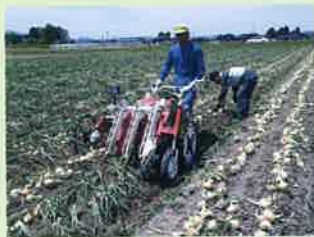
機械による玉ねぎの収穫作業