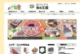
ホームページのトップ画面

●越中とやま食の王国HPへのアクセス件数 20,000 件 / 月平均 (H25) → 41,000 件 / 月平均 (H33)