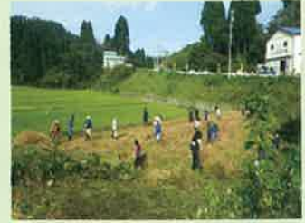
耕作放棄地の復元・除草作業

●中山間地域直接支払 協定締結集落数 395 集落 (H25) → 410 集落 (H33)