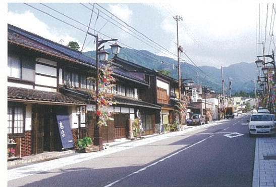
大暖簾を掲げ、道路に面して草花を植えるなど訪れる人に心地良いもてなしの景観づくり(南砺市井波上新町通り)

住民協定を締結するための話し合いや調査などの経費、また、住民協定に基づいて、生垣やポケットパーク等の整備、建築物等の修景等に要する経費について、市町村とともにその一部を助成する景観づくり事業費補助金制度があります。