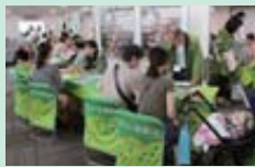
とやま移住・転職フェア