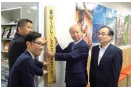
富山くらし・しごと支援センター大手町オフィス H30年5月23日オープン

また、既に富山県に移住された方に対しても、同センターの相談員が生活相談に応じるほか、移住者同士の親交を深める機会を設けるなど、移住後のフォローアップにも力を入れていきます。