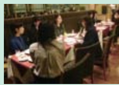
就活女子応援カフェ