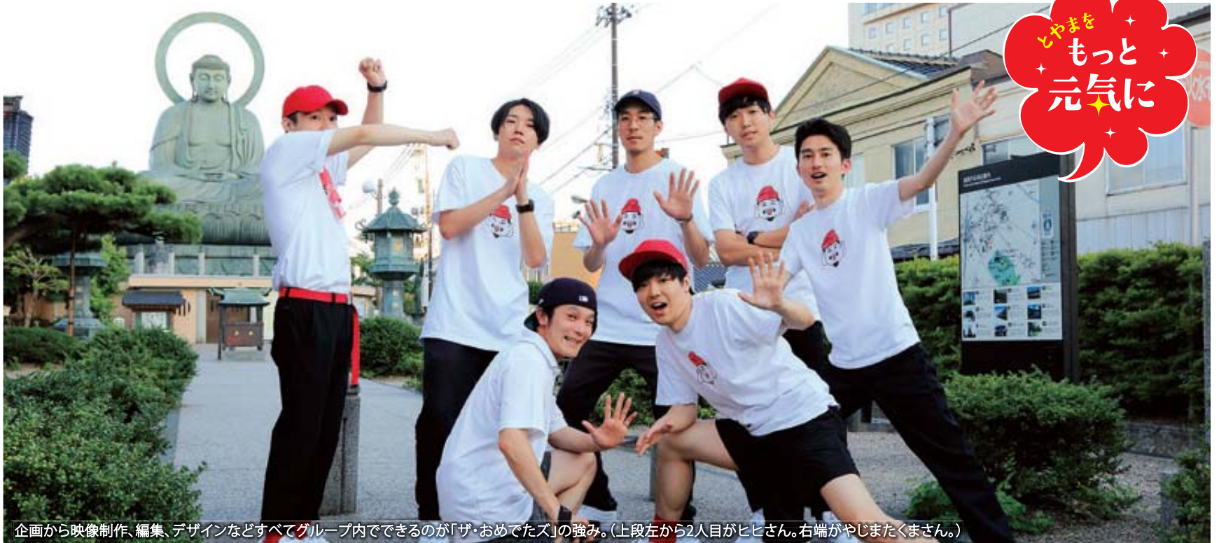
企画から映像制作、編集、デザインなどすべてグループ内のできるのが「ザ・おめでたズ」の強み。(上段左から2人目がヒヒさん。右端がやじまくさん。)