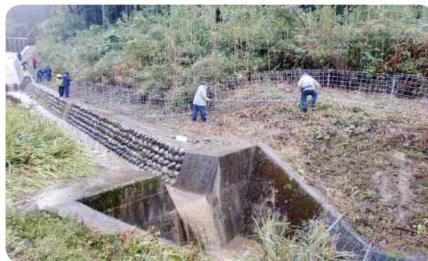
イノシシ侵入防止柵の設置