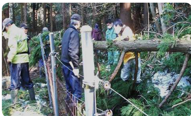
電気柵周辺の環境整備

有害鳥獣対策の電気柵について、設置・撤去や管理作業などの労力を軽減する目的から、耐雪型侵入防止柵を導入している。導入後は、点検班を編成し、当番制により点検・管理作業を行っている。また、電気柵周辺の雑草の繁茂が予想される場所への除草剤の散布、農用地近隣山林の草刈等整備、有害鳥獣（特に猿）の被害防止のため渋柿（刀根早生）の栽培も行って生産活動を継続している。