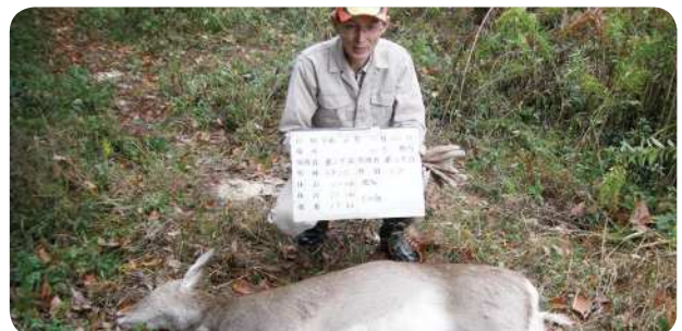
有害鳥獣の捕獲活動