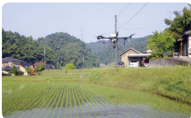
ドローン農薬散布

また、防除作業の省力化を図るため、生産性向上加算を活用して令和3年度からドローンを使用した農薬散布を実施している。若い世代がオペレーターとして活動することで、継続性のある地域農業を目指して取り組んでいる。