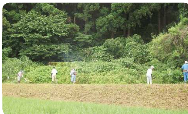
山林の草刈等整備