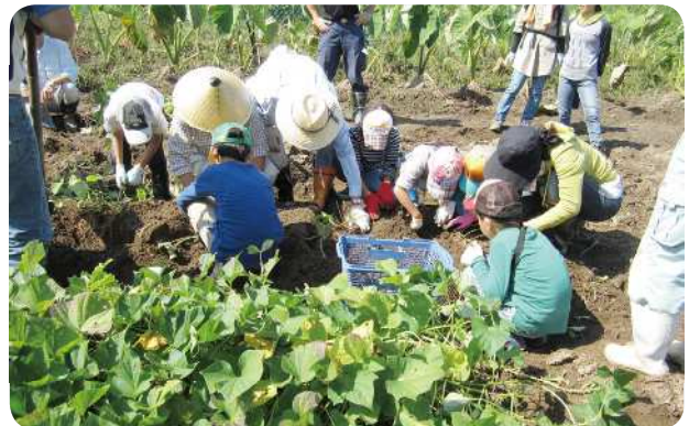
子供達を交えての農作業交流：稲刈り、野菜の収穫