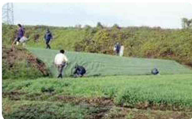
防草シートの設置

本集落では、水路、農道の維持管理を始め、農地法面の定期的な点検や輪作の徹底を共同で行っている。また、令和2年度から生産性向上加算を活用し、維持管理の困難な急勾配の法面への防草シートの設置や自走式草刈機を導入することで、維持管理に要する負担の軽減に取り組んでいる。