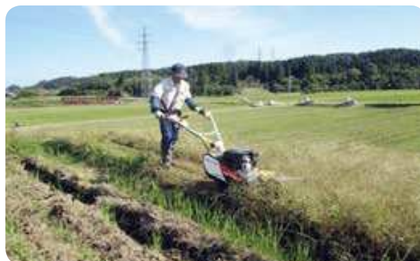
自走式草刈機による草刈り