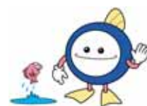
下水道マスコットキャラクター スイスイ