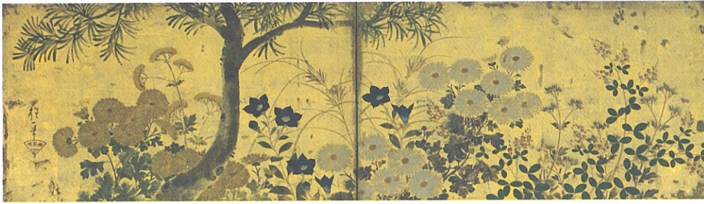
左より 酒井抱一《横に秋草図屏風》江戸後期 細見美術館蔵 依屋宗達《双犬図》江戸前期 細見美術館蔵 尾形光琳《柳図香包》江戸中期 細見美術館蔵