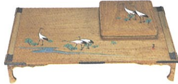
神坂雪佳《若松鶴図文机・硯箱》 大正末頃 細見美術館蔵