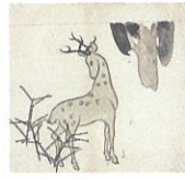
左 神坂雪佳《鹿図時絵手元筆筒下図》大正末～昭和初 個人蔵 右 神坂雪佳(図案) 神坂祐吉(作)《鹿図時絵手元筆筒》 大正末～昭和初 京都国立近代美術館蔵