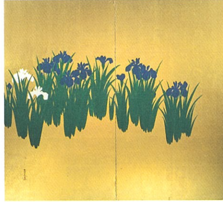
神坂雪佳《杜若図屏風》大正末～昭和初 個人蔵