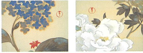
神坂雪佳《十二月草花図》より「六月 紫陽花」「五月 牡丹」 大正末～昭和初 細見美術館蔵