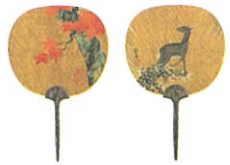
酒井抱一《鹿図扇》 江戸後期 細見美術館蔵