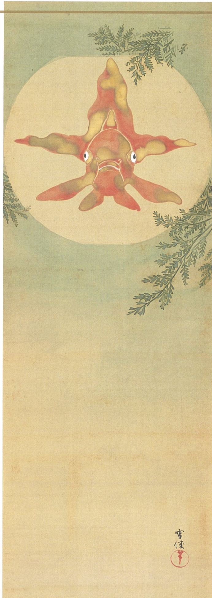
神坂雪佳（金魚玉図）明治末頃 細見美術館蔵