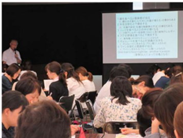
食育研修会の開催