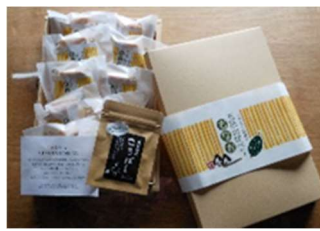
五箇山ぼべら最中