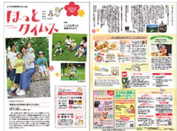
2019年号—こころを育てる会話のちから—