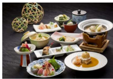
(冬の陣 「越中料理と地酒を楽しむ会」の料理)