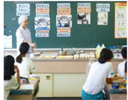
栄養教諭による授業風景