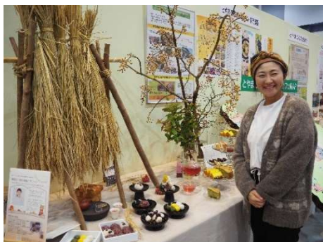
「越中とやま食の王国フェスタ 2019～秋の陣～」 女性起業の開発商品の利用等について PR