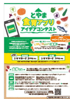
コンテスト募集チラシ