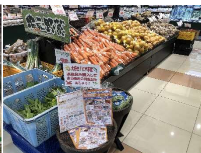
サービスカウンターや売場での応募用紙・応募箱の設置