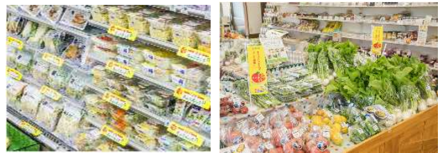
店舗でのキャンペーン実施