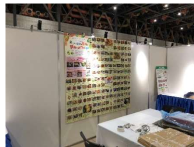
とやま環境フェアでのパネル展示