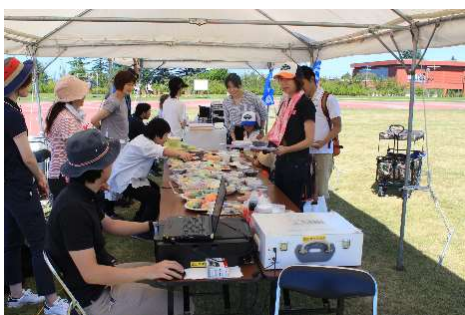
県ウォーキングイベントにおける 栄養相談の様子