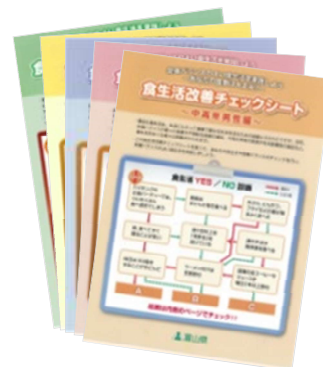
食生活改善チェックシート