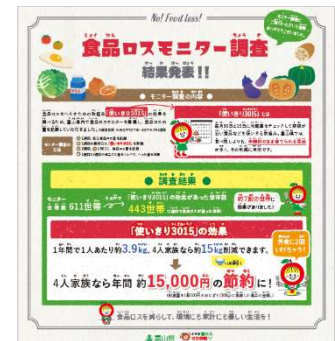
モニター調査結果の紹介