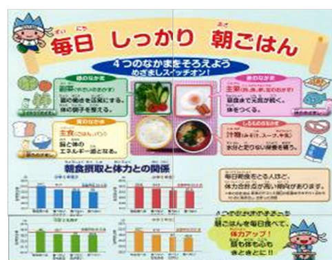
食育啓発カレンダーの上部（朝食摂取と体力との関係）