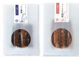
新商品「ぶり燻製」 「さくらます燻製」