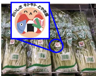
県産品に貼られる地産地消シール

食品スーパーマーケット・百貨店、青果店、加工食品製造直売所など (327 店舗) 米・青果・鮮魚・精肉・加工食品などに貼り付けてある県産を示す「地産地消シール」や「価格ラベル」を 10 枚集めて応募