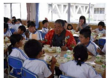
「県産食材活用拡大プロジェクト事業」を活用した協議会運営・特別給食・生産者との交流活動