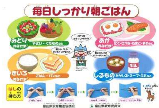
食育ランチマットを用いた食育啓発運動（小学校）