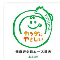
健康寿命日本一 応援店ステッカー