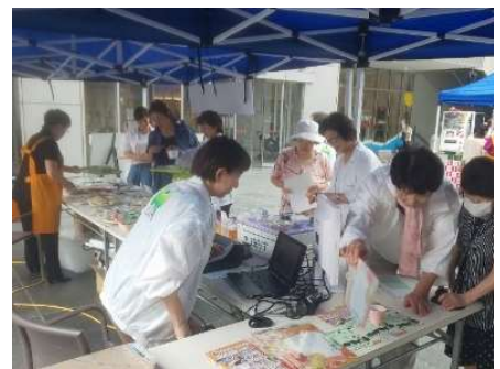
富山型食生活の普及・啓発 (野菜を食べようキャンペーン)