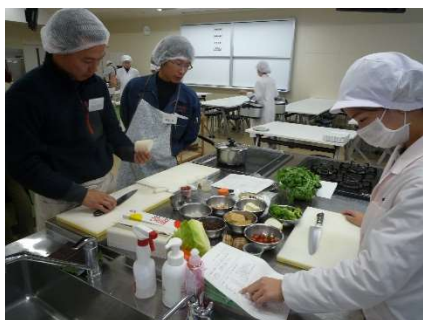
若者世代を対象とした調理体験と完成した料理