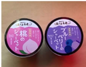
果実シャーベット