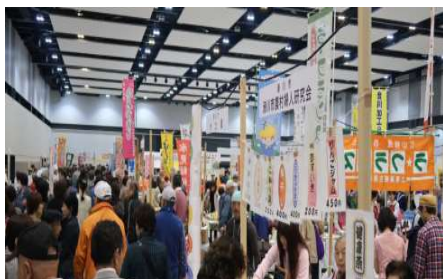
(秋の陣 富山テクノホール)