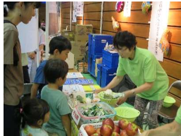
出前イベントでの食育指導