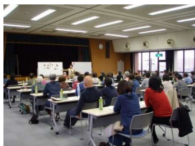
食育リーダーによる食に関する研修会