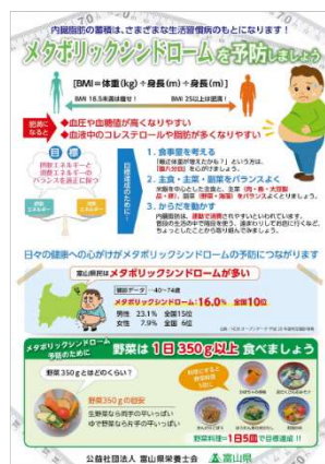
メタボ予防普及啓発の リーフレット