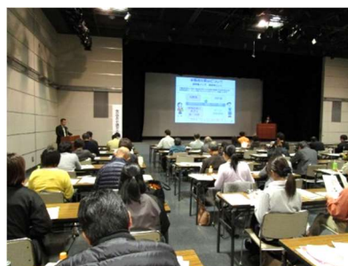
食品表示講習会の様子