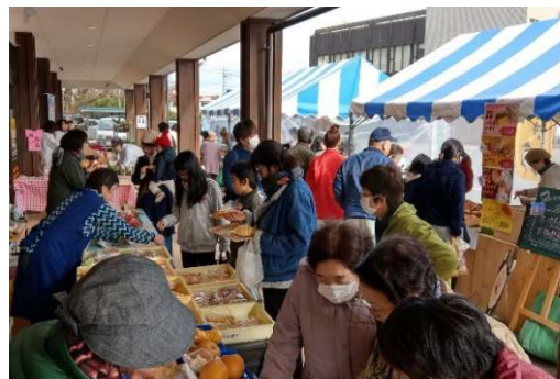
「畑パーティとやま」による消費者イベント 農村女性起業ネットワークによる PR 活動