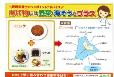
スーパーに掲示したPOP