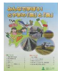
副読本を活用した授業