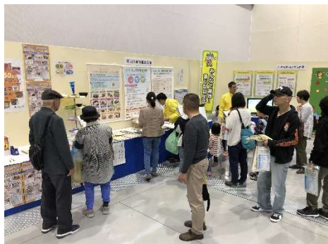
イベントによる富山型食生活の普及・啓発 「越中とやま食の王国フェスタ 2019～秋の陣～」