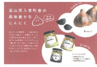
黒ニンニク・ガーリックオイル