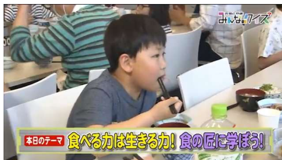
県政番組「元気とやま みんなのクイズ」