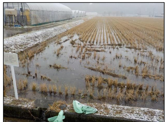
富山地域地下水利用対策協議会での涵養事業（立山町内）