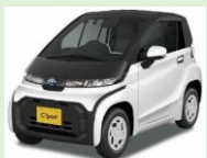
C+pod[シーポッド] (超小型電気自動車)

スマホだけで予約、利用(解錠・施錠)、精算まで可能なサービス。(現在、県内9カ所のステーションでサービス提供中)