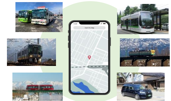
MaaS (Mobility as a Service)