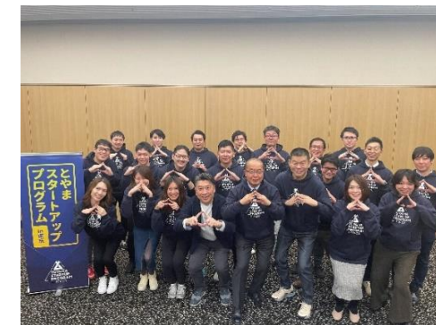
起業家育成プログラム