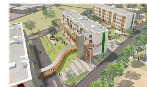
創業支援センター、創業・移住促進住宅 (イメージ)