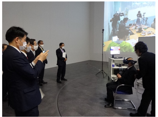
バーチャルスタジオ