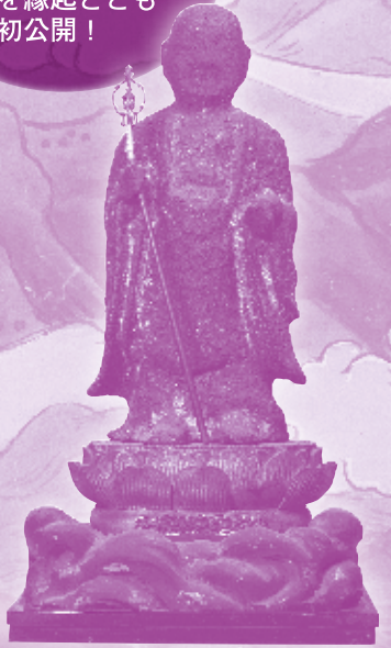
大同地藏菩薩立像(金沢市・眞長寺蔵)