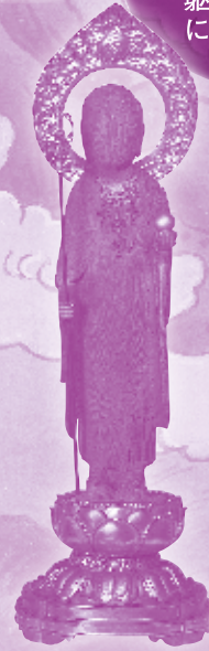
越中立山地獄谷地藏尊(金沢市・養智院蔵)