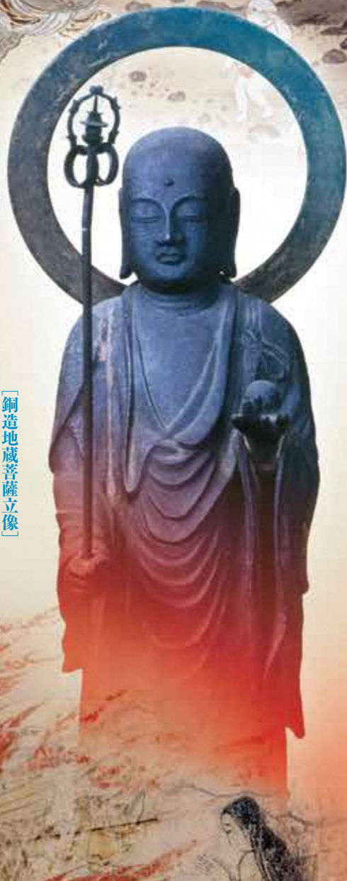
【銅造地藏菩薩立像】 蓮王寺所藏（富山県指定文化財）

親より先に死ななすも望むる妻の河原を描いたもの 子どもに先立たれた親に対して 唱導する目的があったと想われる。