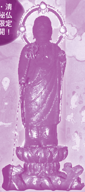
矢場延命地藏尊(名古屋・清浄寺蔵) 展示期間:9月17日(土)~10月16日(日)