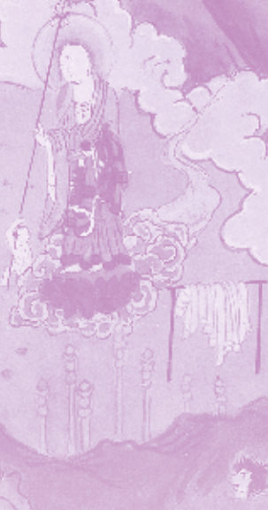
背景:「立山曼荼羅」相真坊A本・賽の河原(立山町・個人蔵)