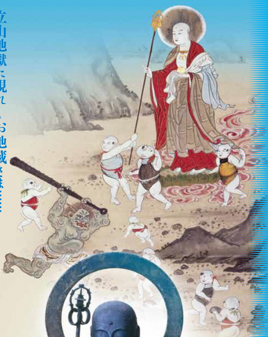
【立山曼荼羅】大仙坊C本賽の河原 芦峯寺大仙坊所藏

親より先に死ななすも望むる妻の河原を描いたもの 子どもに先立たれた親に対して 唱導する目的があったと想われる。