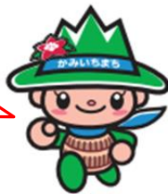
つるぎくん(上市町)

～参加者のみなさまへ～ 当日は、マスクの着用や熱中症対策などにご協力をお願いします。 裏面の健康チェックシートを事前に記入し、当日受付まで提出してください