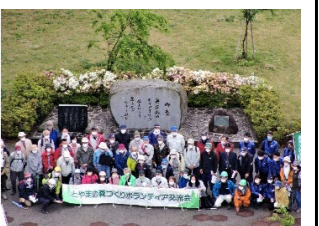
森林ボランティア交流会の開催