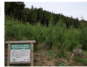
「立山 森の輝き」の植栽