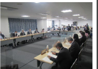
水と緑の森づくり会議(R3.5.12)