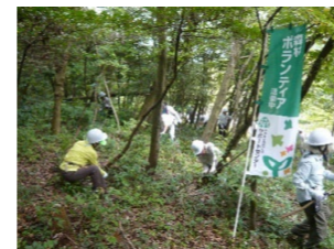
県民による里山林整備