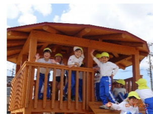
子供達がデザインした県産材遊具