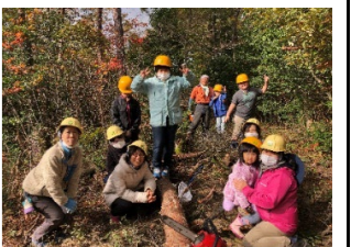
県民が企画・実践する森づくり