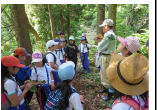
森の寺子屋の開催