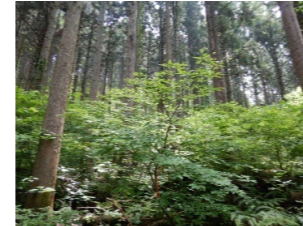
混交林化が進む人工林