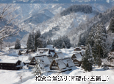
相倉合掌造り(南砺市・五箇山)