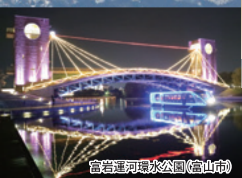
富岩運河環水公園(富山市)