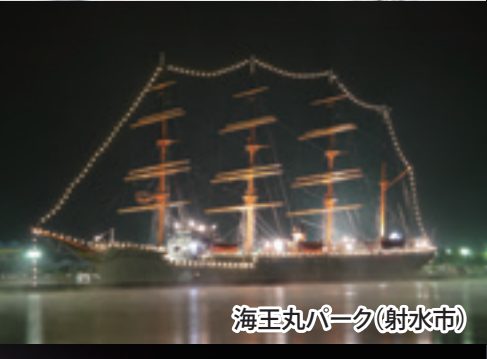
海王丸パーク(射水市)