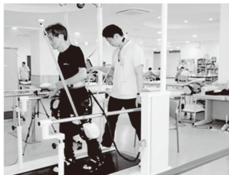
リハビリテーション風景