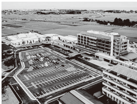
富山県リハビリテーション病院 ・こども支援センター