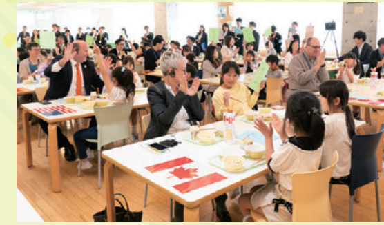
給食中のクイズで大盛り上がり