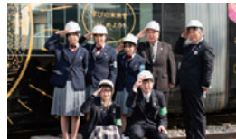
高校生の視点で会合を取材

石動高校・富山国際大学付属高校の新聞部が会合に関わった子供たちを取材し、新聞を発行。同世代に発信しました。