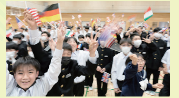
ウェルカム・トゥー・八尾中学校！