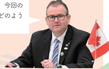
カナダ エフスコモント州教育・幼児教育大臣

皆さんの夢はなんですか？また、今回のこどもサミットの経験が、今後どのように役立つと考えますか？