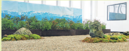
富山駅にミニ庭園を設置