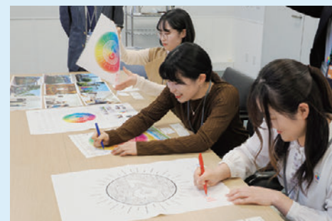
資料にサインを求められる場面も