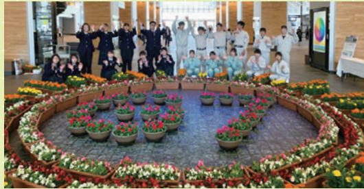
G7のロゴマークをイメージして装飾

中央農業高校・小矢部園芸高校の生徒が、自分たちで育てた花で富山駅を装飾。中央農業高校は、ミニ庭園も作りました。