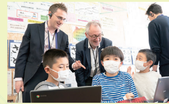
授業参観はちょっと緊張？！