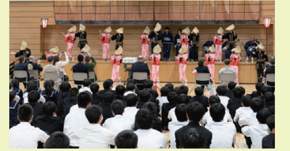
郷土芸能部がおわら踊りを披露