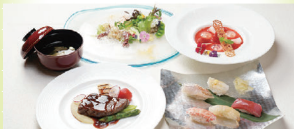
富山の海の幸・山の幸いっぱい夕食会メニュー

美味しい「食」で富山を記憶に残してもらおうと、新鮮な県産食材をメインとした料理を提供。富山でしか味わえないご馳走を楽しんでいただきました。