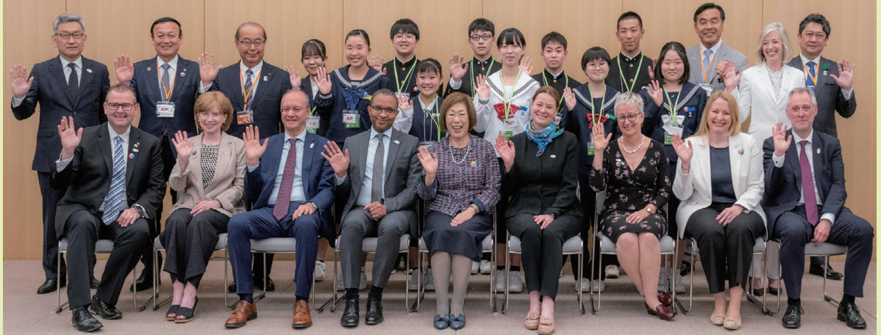
こどもサミット宣言書に関する意見交換(2023年5月13日、富山国際会議場にて)