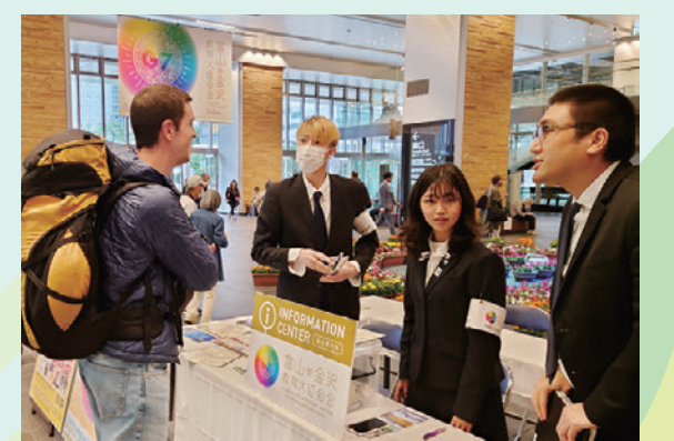
富山駅の総合案内所で道案内