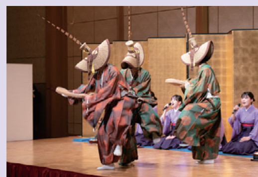
南砺平高校郷土芸能部