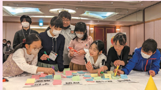
学んだことをまとめてグループごとに発表