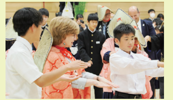
最後はみんなで輪踊り