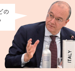
イタリア ヴァルディターラ教育・幼穉大臣

例えばAIを有効活用することで、一人一人の能力に差があっても、それぞれに合った教育ができるのではと考えています。