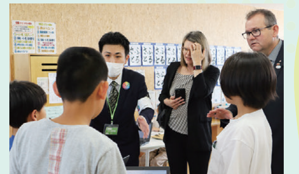
大臣と子供の会話をサポート

総合案内所やエクスカージョンでは、県内の大学・専門学校が通訳補助・案内を担当。富山の魅力をたっぷり発信しました。