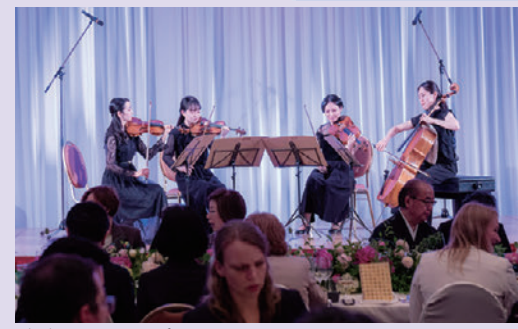
桐朋アカデミー 弦楽四重奏団