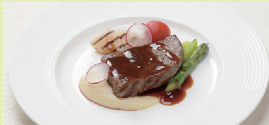
夕食会で振る舞われた「とやま和牛酒粕育ちロースのグリエ」