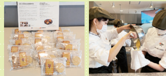
県産食材をたくさん使い、食の魅力アピール