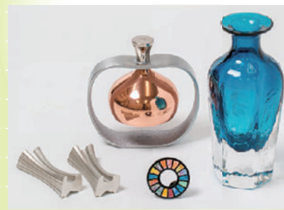
音のインテリア おりん、富山ガラスの輪挿し、富山県の形の箸置き、蝶紐のSDGsバッジ

各国大臣への記念品として、富山の工芸品セットをお渡し。富山には、伝統技術を使った、普段使えておしゃレなアイテムがたくさんあります。