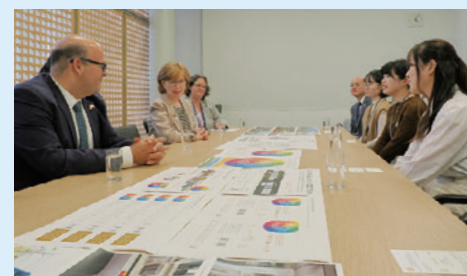
「マークが私たちが優しく和ませてくれたことに感謝」とアメリカ代表団