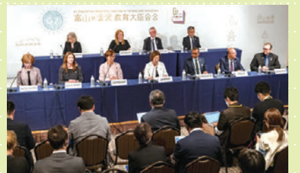
宣言採択後の共同記者会見

宣言には、デジタル化のよさとリスクを理解し教育に取り入れること、各国間の子供たちの交流をコロナ禍前より拡大させること、そして富山県が政策の柱として位置付けている「ウェルビーイング」を高めていくことなどが盛り込まれました。