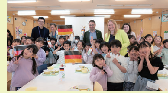
一緒に給食、楽しかったね