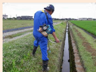
危険箇所の草刈り