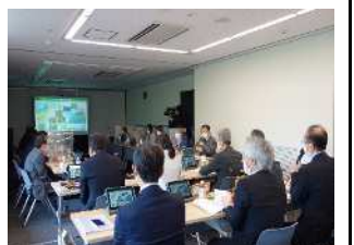
水と緑の森づくり会議(R4.5.10)