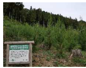
「立山 森の輝き」の植栽