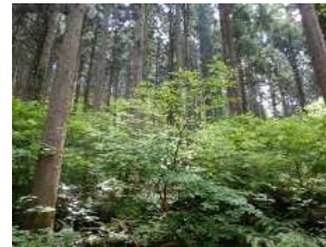
混交林化が進む人工林