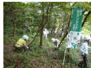
県民による里山林整備