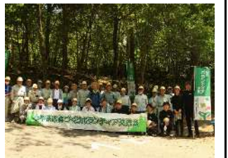
森林ボランティア交流会の開催