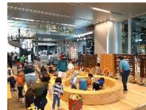
とやま木育フェアの開催(富山駅)