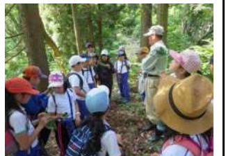
森の寺子屋の開催