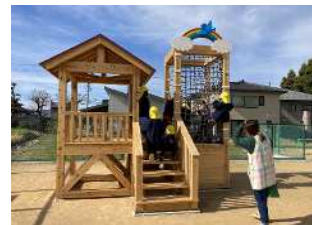
子供達がデザインした県産材遊具