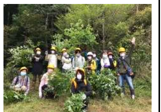
県民が企画・実践する森づくり