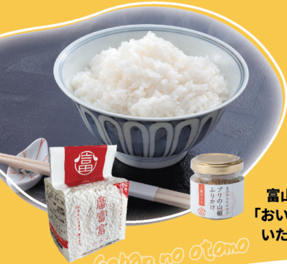
Gohan no otomo