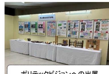
ポリテックビジョンへの出展