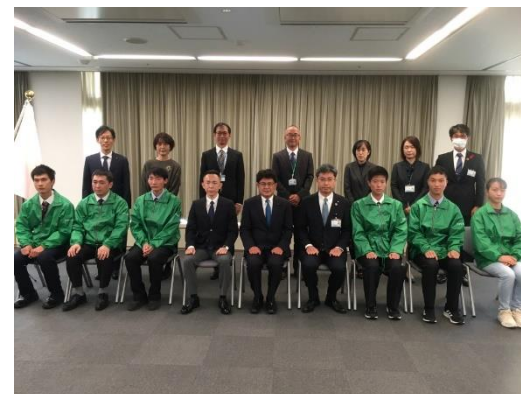
アビリンピック選手団激励会