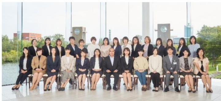
煌めく女性ネットワーク事業