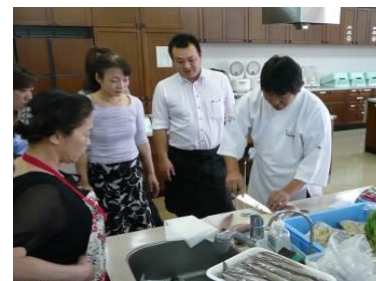
とやま観光未来創造塾