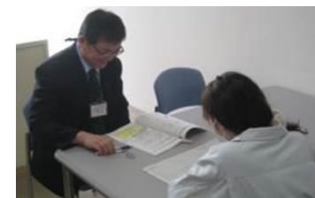
キャリアコンサルティング