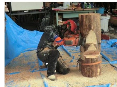
伐木技能高度化研修