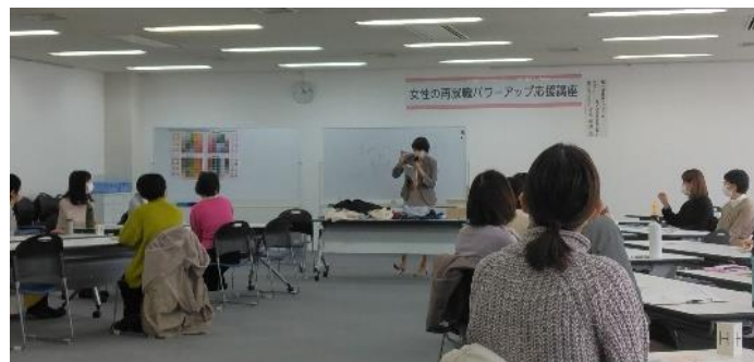
女性の再就職ハローアップ応援事業