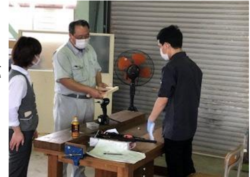
技能実習生講習(金属プレス)