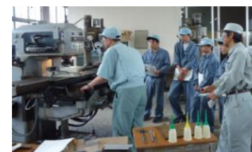
高校生に対する技能出前講座