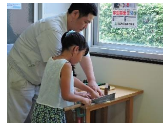
夏休みものづくり体験