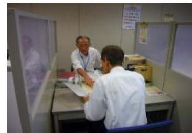
とよまシニア専門人材バンク