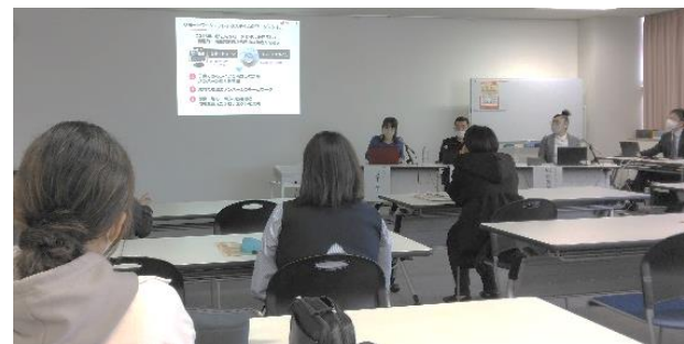
女性の多様な働き方支援事業