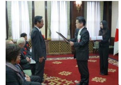
職業能力開発優良企業表彰