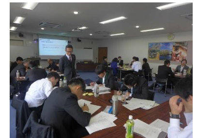
とやま中小企業人材育成カレッジ