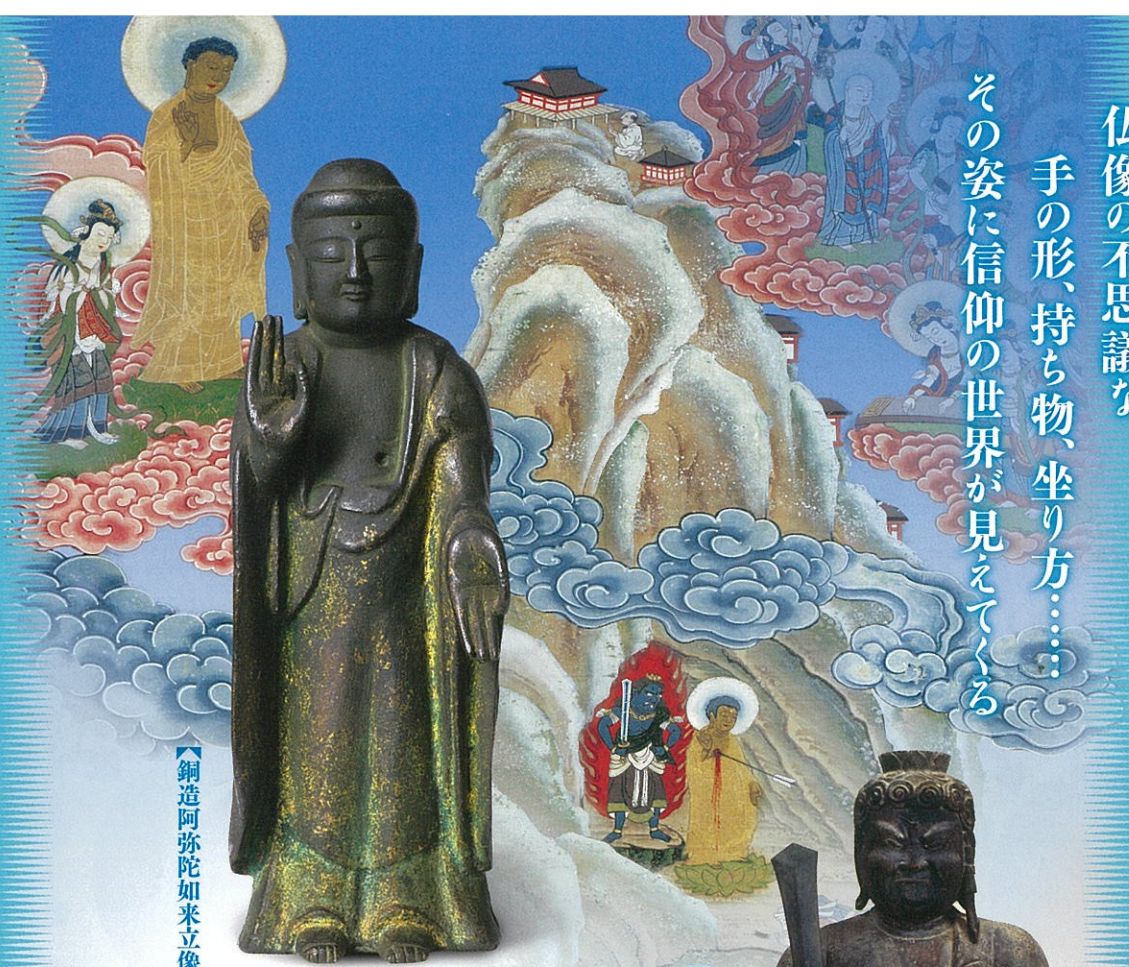
【銅造阿弥陀如来立像】